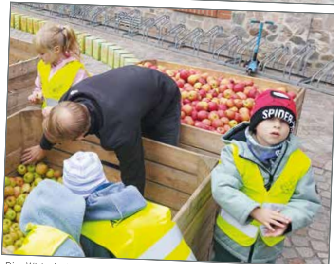
Die Wirtschaftsjuvenen der Börde haben im Oktober dafür gesorgt, dass Kinder aus den Kindertagesstätten „Barleber Schlümpfe“ und „Gut Arnstedt“ in Barleben, „Gänseblümchen“ in Ebendorf und „Birkenwichtel“ in Meitzendorf auf dem Hof der Mittellandhalle zuschauen konnten, wie aus ihren mitgebrachten Äpfeln in der mobilen Saftpresse leckerer Saft gepresst wurde. Sie konnten auch Äpfel und Saft gleich vor Ort testen.