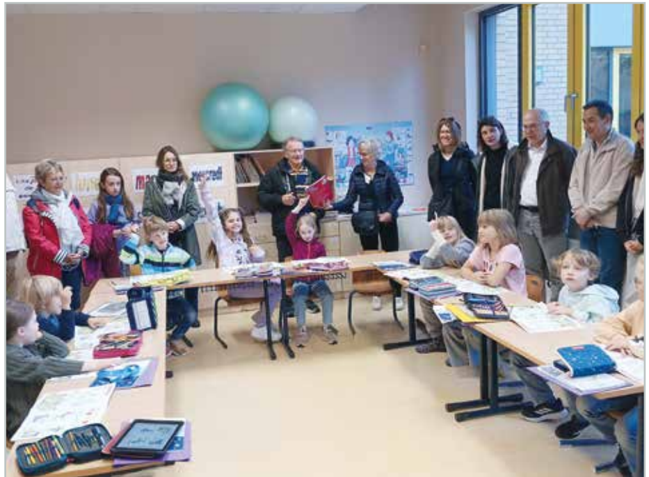
Die Delegation besuchte auch die Ecole-Grundschule in Barleben und überzeugte sich davon, wie gut die Schülerinnen und Schüler mit dem zweisprachigen Lernen arbeiten können.