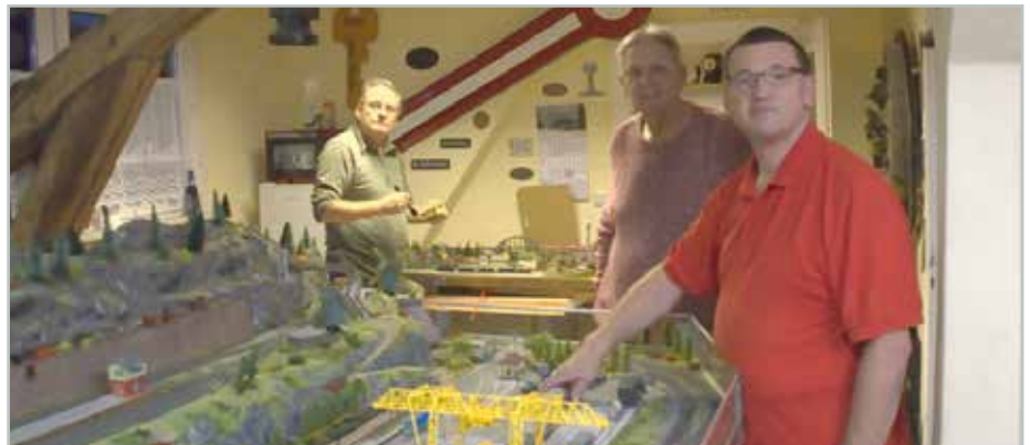
Unter dem Dach im alten Rathaus bauen die Modellbahnfreunde stetig an ihrer Anlage weiter. Im Dezember kann sie besichtigt werden.

>> Der Barleber Modellbahnverein öffnet auch in diesem Jahr am 6. Dezember seine Türen und lädt alle Interessierten herzlich ein, einen Blick in die Welt der Miniaturbahnen zu werfen. In den Vereinsräumen sowie im Schulungsraum der Fahrschule Witt, Breite Weg 50, werden Anlagen gezeigt, die das Herz jedes Modellbahnfreundes höherschlagen lassen. Zu sehen sind unter anderem der Baufortschritt und Fahrbetrieb auf der H0-Anlage sowie die detailreiche Amerika-Anlage. Im Schulungsraum wird zusätzlich eine Gartenbahnanlage präsentiert, die mit aufwendiger Gestaltung und liebevoller Handarbeit überzeugt. Ergänzt wird die Ausstellung durch eine rekonstruierte TT-Anlage zweier Vereinsmitglieder sowie die beliebte TT-Insel, die eindrucksvoll zeigt, wie vielseitig das Hobby Modellbahn sein kann. Ein weiteres Highlight im Vereinsjahr sind die Modellbautage im City Carré Magdeburg am 7. und 8. November.