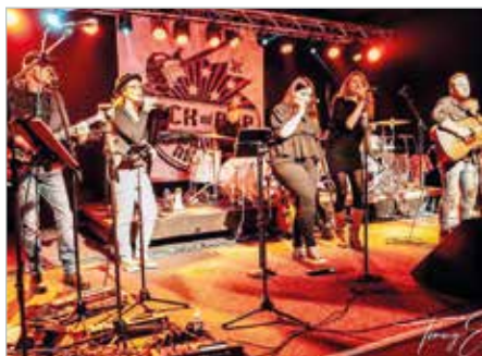
ZEITLOS spielen am 15. November auf Webers Hof in Farsleben.

Gespielt wird diesmal nur auf der großen Bühne, damit mehr Platz für Tanz und Party ist. Fleißige Weberaner werden wie immer die Konzertbesucher mit Speisen und Getränken versorgen. Karten gibt es im Vorverkauf für 20 Euro bei der Änderungsschneiderei Osinsky in Farsleben, im Café Cappuccino, bei Floristik99 und im Kaufcenter Deutsche Post in Wolmirstedt sowie in Colbitz in der Sportlerklause, außerdem online über Eventim. An der Abendkasse kosten die Karten 23 Euro. (rms/aa)