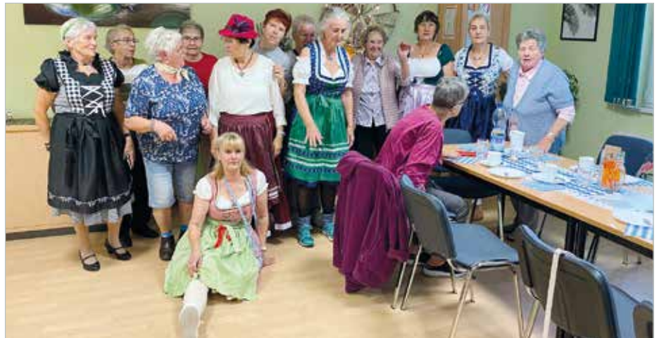
Ein zünftiges Oktoberfest gab es in der Alten Feuerwehr in Meitzendorf.

Bei Weißwurst, Brezn und stimmungsvoller Musik wurde gelacht, gesungen und getanzt. Schnell sprang die gute Laune auf alle über, und die Alte Feuerwehr verwandelte sich in ein kleines Festzelt voller