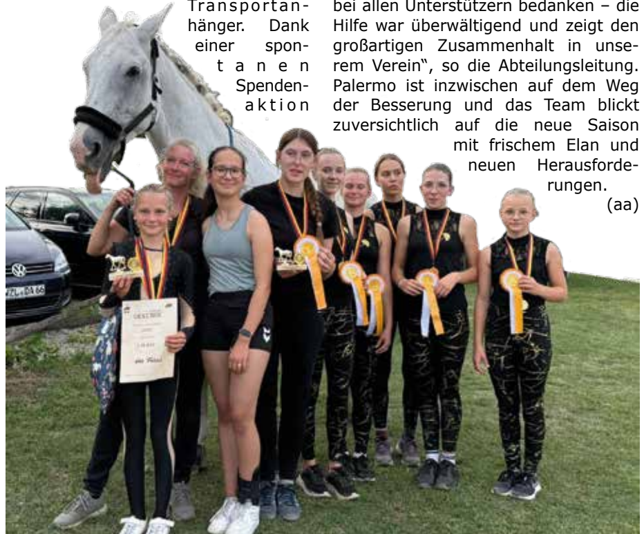
Die erfolgreichen Voltigiererrinnen der SG Motor Barleben.

der Eltern konnte der Verein die Kosten abfedern. „Wir möchten uns herzlich bei allen Unterstützern bedanken – die Hilfe war überwältigend und zeigt den großartigen Zusammenhalt in unserem Verein“, so die Abteilungsleitung. Palermo ist inzwischen auf dem Weg der Besserung und das Team blickt zuversichtlich auf die neue Saison mit frischem Elan und neuen Herausforderungen. (aa)