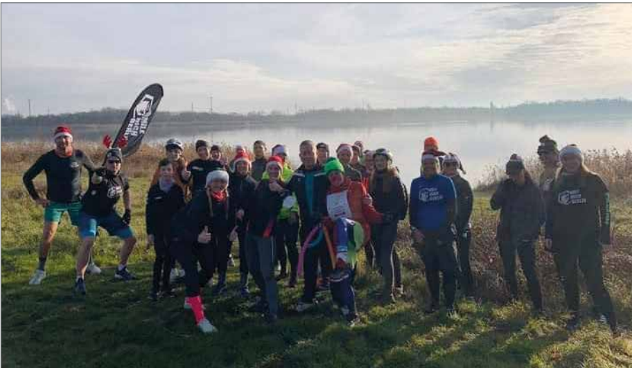
Am Neustädter See führt die Laufstrecke entlang.

sogar auf Langlaufski – alles ist erlaubt und erwünscht. Zur Teilnahme ist ein Spendenbeitrag von mindestens sieben Euro vorgesehen. Als Dankeschön erhalten alle Teilnehmenden eine ganz besondere Medaille, die von den Kindern der Kita „Gut Arnstedt“ liebevoll gestaltet wurde. Die Spenden kommen Projekten für Kinder in der Region zugute. Die Anmeldung und Bezahlung ist unkompliziert über PayPal unter hr2104@web.de möglich oder persönlich bei Sicht/Barleben (ehemals Optik Kurz). (pm/aa)