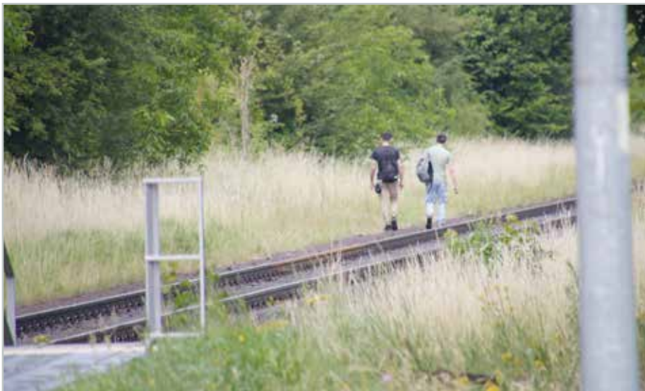
Immer wieder beobachtet: die lebensgefährliche Abkürzung entlang des Gleises.