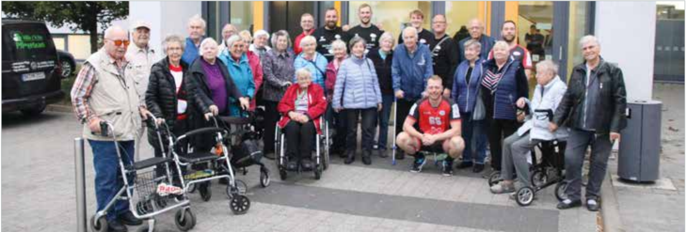
Die Senioren vom Sonnenhof machten einen Ausflug zum Barleber HC.