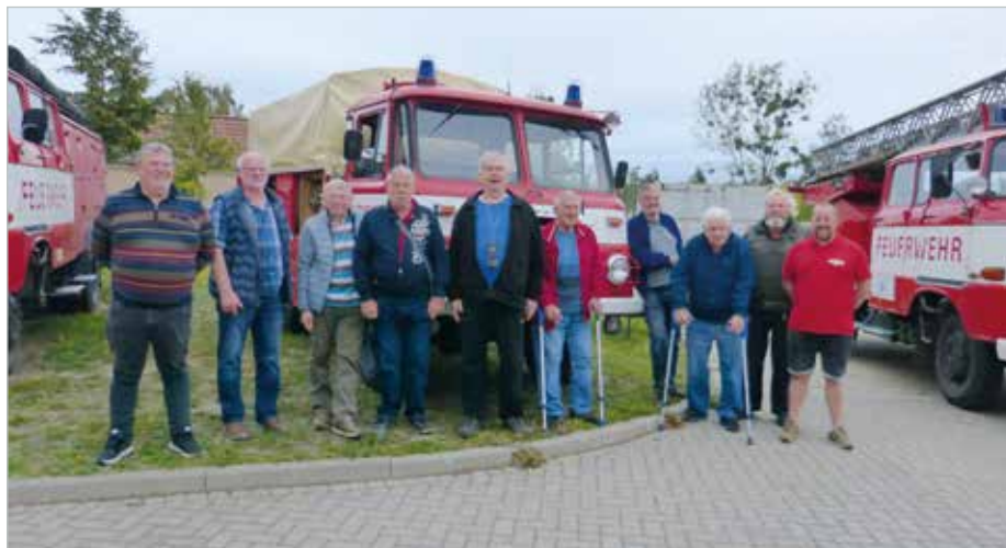
Die FFW Meitzendorf besuchte die Ausstellung der FFW Haldensleben.