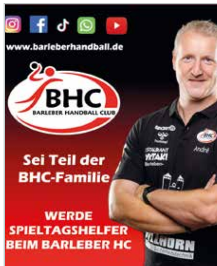
Die BHC-Familie in Barleben sucht freiwillige Helferinnen und Helfer für ihre Spieltage in der Mittellandhalle.

Der Barleber Handball Club bietet engagierten Ehrenamtlichen optimale