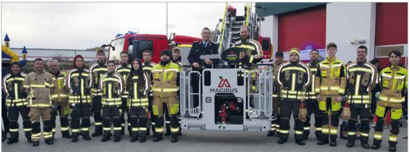
Ein Erinnerungsfoto von der Übergabe mit den Kameradinnen und Kameraden (oben). Unten: Bei der Halloween-Party der Feuerwehr hatten nicht nur Kinder und Jugendliche sichtlich großen Spaß.