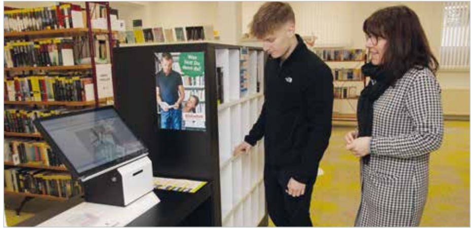
In der Bibliothek sorgt moderne Technik für schnellere Abläufe.

Auch die Rückgabe funktioniert kinderleicht - die Medien kommen einfach in eines der Fächer im Regal direkt neben dem Scanner. Eingebaute Technik im Regal erkennt die Medien anhand der darin befindlichen Chips und bucht sie vom Konto der Nutzerinnen und Nutzer als zurückgegeben aus. Wer natürlich lieber die Mitarbeiterinnen und Mitarbeiter der Bibliothek sprechen mag, kann auch weiter bei ihnen Medien ein- und ausbuchen.