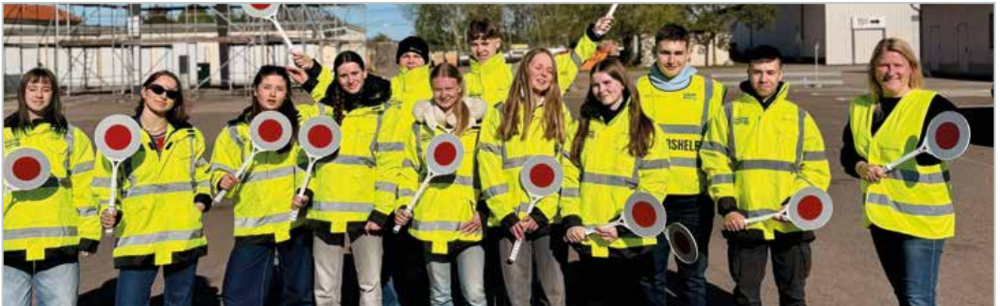
Die neuen Schülerlotsinnen und -lotsen sind bereits in Barleben im Einsatz.