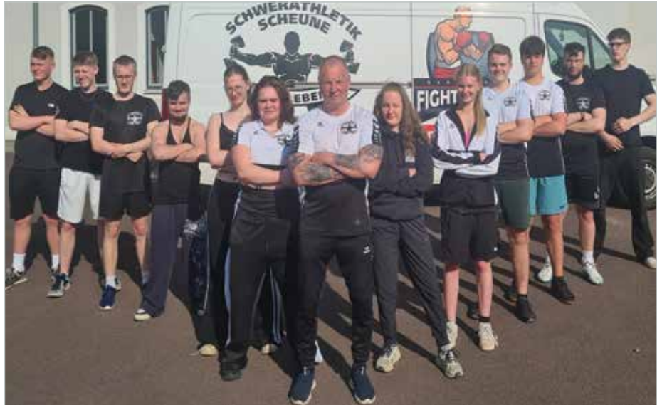
Die Jugendlichen der Schwerathletikscheune Barleben bereiten sich auf die Wettkämpfe Ende September und Anfang Oktober vor.