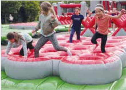
Bewegung wurde bei „Fritz Fit“ groß geschrieben.