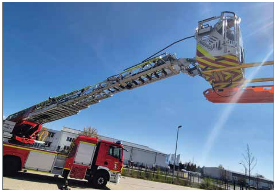
Die Drehleiter ist mittlerweile offiziell in Dienst gestellt und hat auch schon die ersten Einsätze absolviert.