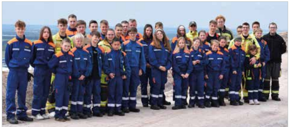
Bewegung wurde bei „Fritz Fit“ groß geschrieben.

Abrollbehälter und das dazugehörige Trägerfahrzeug (ein Vierachser MAN) sowie das Hilfeleistungslöschgruppenfahrzeug und das Gerätehaus genau inspiziert. Die Kids konnten alles fragen, was sie schon immer über die Arbeit einer Werkfeuerwehr wissen wollten. Zum krönenden Abschluss ging es hoch auf die Halde! Die Aussicht war gigantisch und der perfekte Spot für tolle Fotos. Ein herzliches Dankeschön an die Kameradinnen und Kameraden der Werkfeuerwehr von K+S für diesen unvergesslichen Stunden und die tolle Organisation. (Ines Opitz)