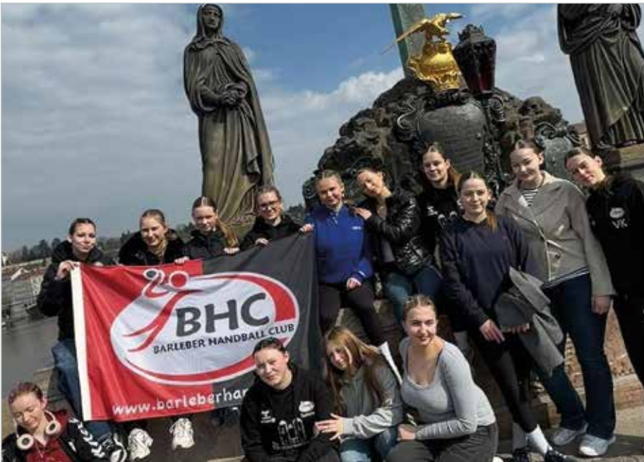
Das Wochenende in Prag war für die Handballerinnen erfolgreich.