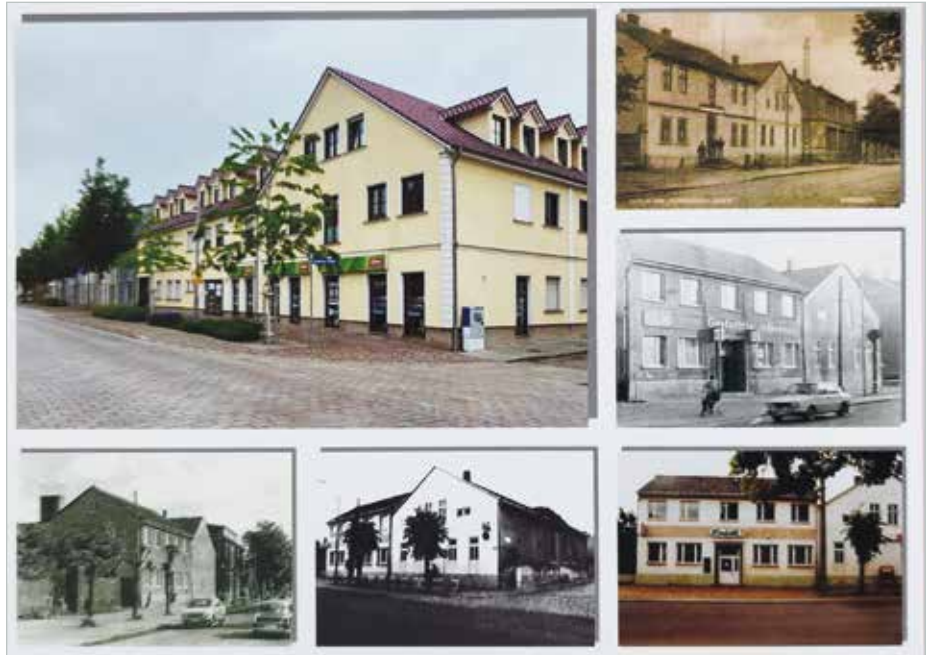
An der Stelle des „Schwarzen Adlers“ steht heute ein Neubau.

Hochbetrieb herrschte besonders in den 70er Jahren, als der „Schwarze Adler“ schon längst offiziell in „Volkshaus“