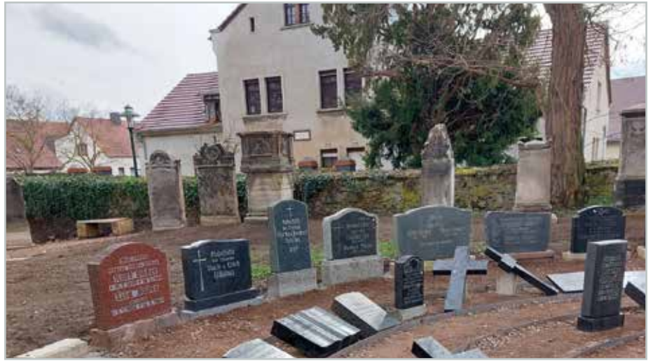
Der öffentliche Erinnerungsgarten auf dem Gelände der Ev. Kirchengemeinde St. Peter und Paul.

In Barleben entsteht auf dem Gelände der Evangelischen Kirchengemeinde St. Peter und Paul ein ganz besonderer öffentlicher Erinnerungsgarten: Über 120 historische Grabplatten erhalten einen würdevollen Platz, das Gelände wird barrierefrei erschlossen und in ein Wegesystem mit Sitzgelegenheiten eingebettet. Dort werden die gesammelten Grabsteine,