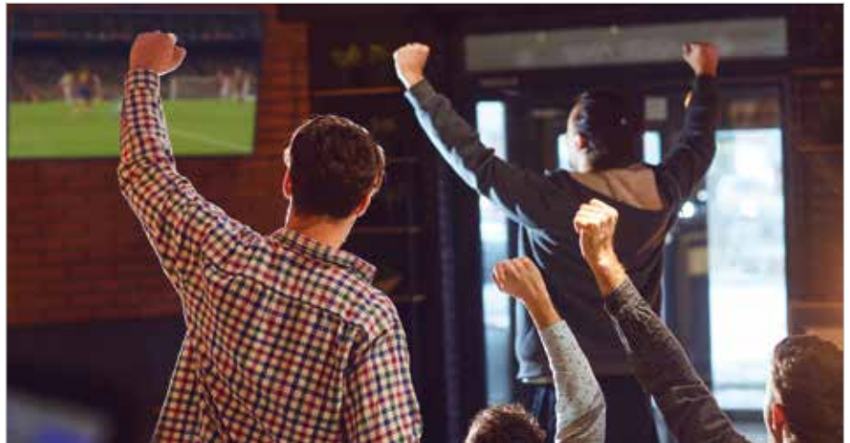
Public Viewing ist während der Fußball-Weltmeisterschaft auf Antrag auch nach 22 Uhr für Gastronomen möglich.

Die Regelung gilt vom 11. Juni bis zum 19. Juli 2026 und soll Städten und Gemeinden ermöglichen, sogenannte Public-Viewing-Veranstaltungen auch nach 22 Uhr zu genehmigen. Betroffen sind unter anderem Fanmeilen, Großleinwand-Übertragungen, Biergärten und andere öffentliche Veranstaltungen im Freien. Eine automatische Erlaubnis für Veranstaltungen gibt es jedoch nicht. Jede Veranstaltung muss weiterhin von den zuständigen Behörden einzeln geprüft werden. Dabei ist zwischen dem öffentlichen Interesse am gemeinsamen Fußballschauen und dem Schutz der Nachtruhe abzuwägen.