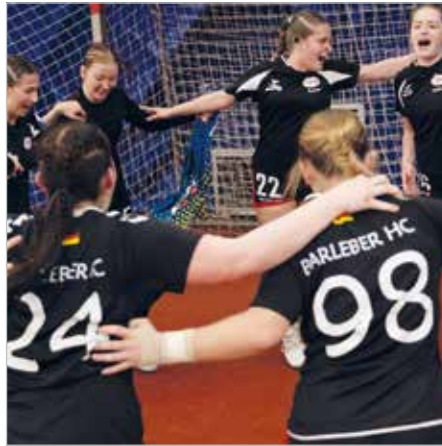
Der Jubel war groß über den erfolgreichen Wettkampf.

Das zweite Spiel ließ lange auf sich warten – erst um 19:45 Uhr war Anwurf gegen das finnische Team vom Grankulla IFK. Die BHC-Mädels