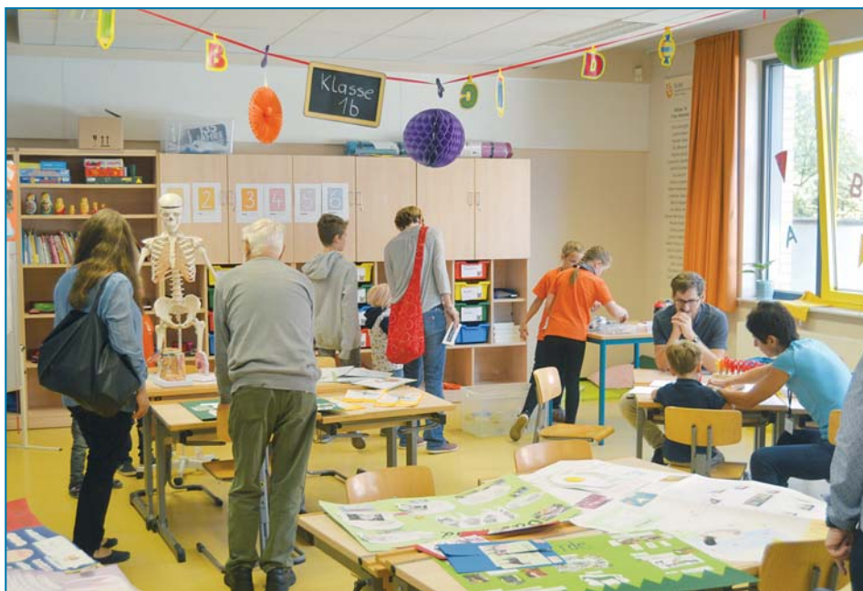
Zahlreiche Kinder und Jugendliche informierten sich mit ihren Eltern am Tag der offenen Tür über die beiden Internationalen Schulen in Barleben