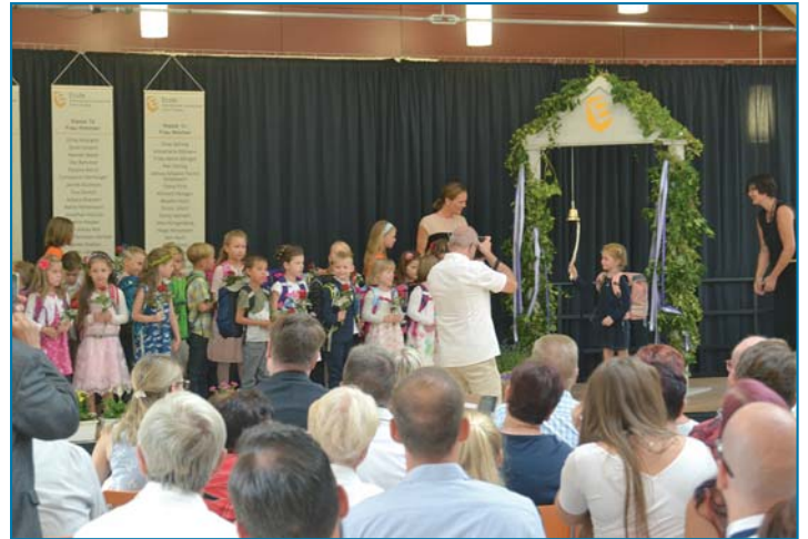
Schnappschüsse von den Einschulungsveranstaltungen in der Barleber Grundschule in der Feldstraße (links) und dem Einläuten in der Ecole-Grundschule.