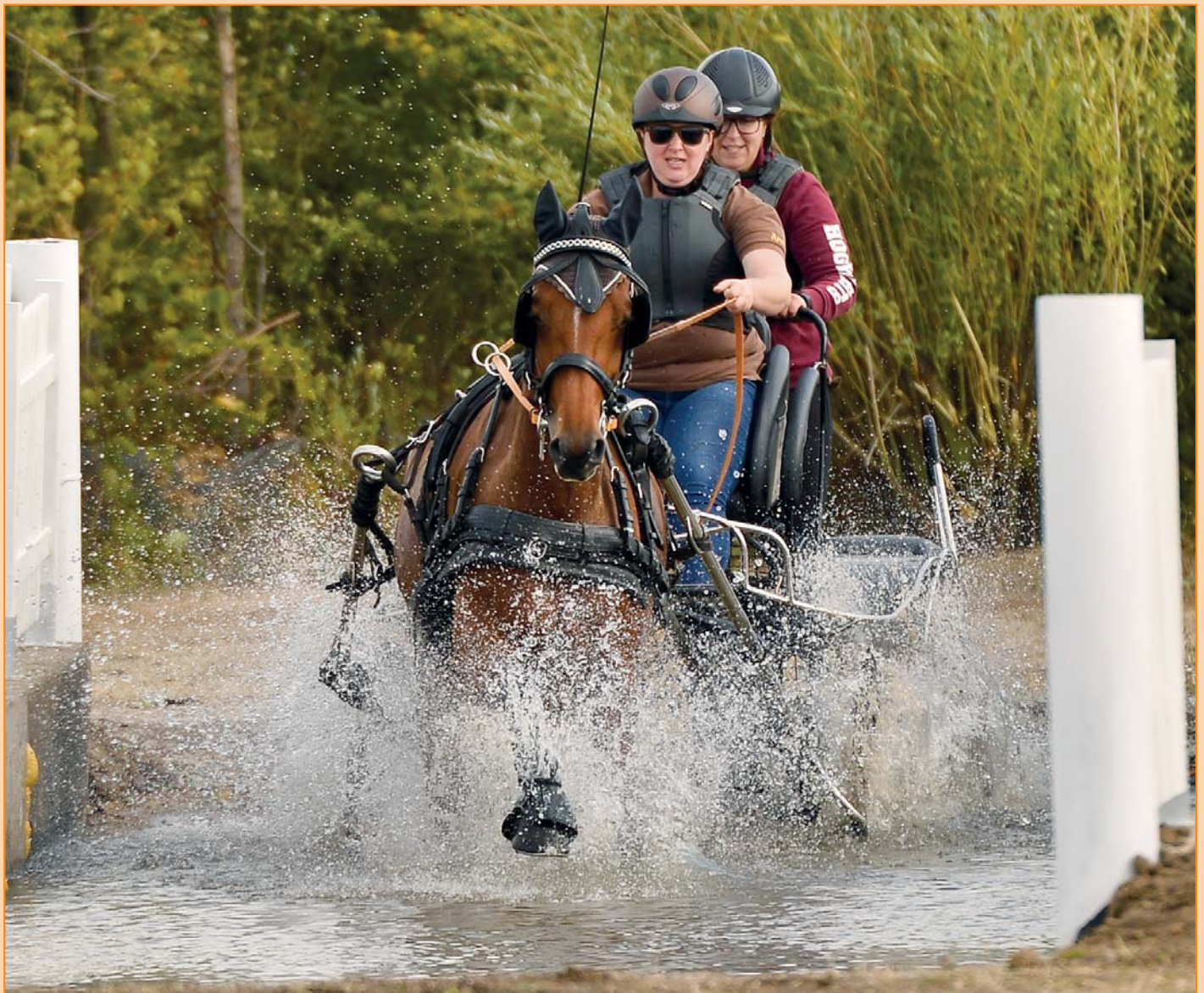
Dramatik am neuen Wasserhindernis