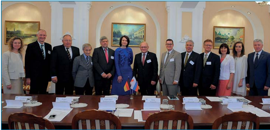
Im August reiste eine Wirtschaftsdelegation aus dem Landkreis Börde für mehrere Tage nach Russland. In der Stadt Omsk wurden die Delegationsteilnehmer von der Bürgermeisterin Oksana Fadina (mi.) empfangen.