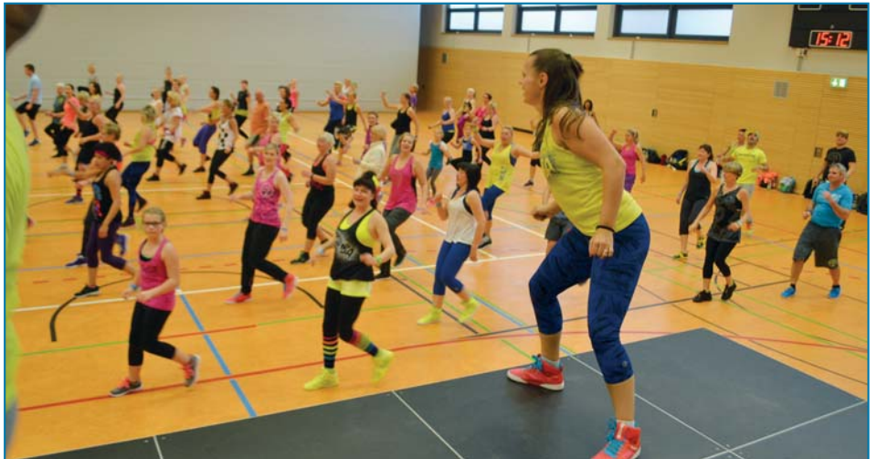
Die Mittellandhalle bietet beste Bedingungen, hier bei einem Zumba-Event.