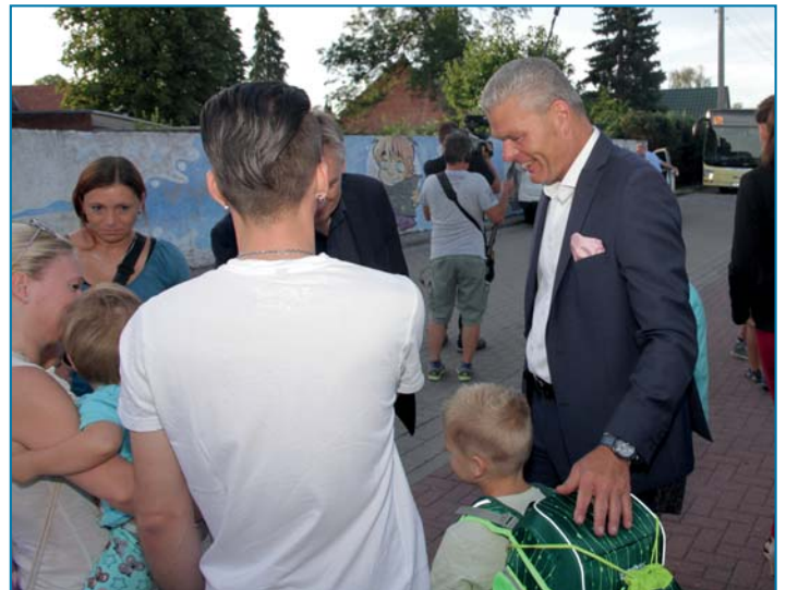
Sachsen-Anhalts Innenminister Holger Stahlknecht besuchte zum landesweiten Schulanfang die Grundschule in Barleben und gab den Erstklässlern einige Hinweise für einen sicheren Schulweg. Unter anderem wurde das richtige Verhalten beim Ein- und Aussteigen in einen Schulbus geübt.