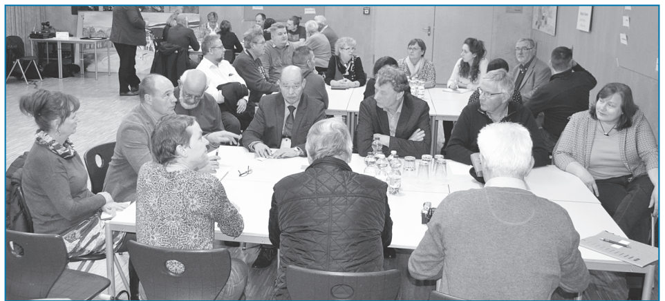
An drei Thementischen wurde jeweils 40 Minuten diskutiert.

Barleber möchten generell in Barleben wohnen bleiben, gerade auch die ältere Generation fühlt sich hier sehr wohl. Angesichts des steigenden Bevölkerungsanteils älterer Menschen wird die Notwendigkeit gesehen, Standorte für altersgerechtes Wohnen zu entwickeln (zentral gelegen mit Grünflächen und Einkaufsmöglichkeiten, Leerstände dafür intelligenter