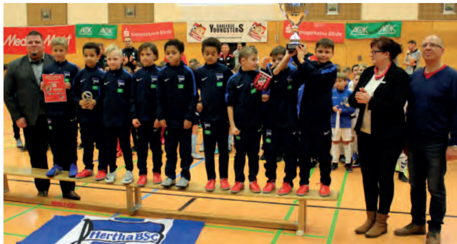
Die U9-Mannschaft von Hertha BSC ging als Sieger aus der Nachwuchsturnier hervor und freute sich über den Pokal.

>> Am 23. Februar fand in der Barleber Mittellandhalle das exzellent besetzte „U9-Hallenmasters der Kreissparkasse Börde“ statt. Den Organisatoren des FSV Barleben ist es auch in diesem Jahr wieder gelungen ein absolut attraktives Teilnehmerfeld im F-Jugendbereich den Zuschauern zu präsentieren. Neben dem gastgebenden Barleber YoungsterS waren Werder Bremen, Hertha BSC, Hansa Rostock, Hertha 03 Zehlendorf, Chemnitzer FC, 1. FC Magdeburg und der 1. FC Union Berlin mit dabei. FCM-Stadionsprecher Torsten Rohde führte als Turniersprecher durch den Tag.