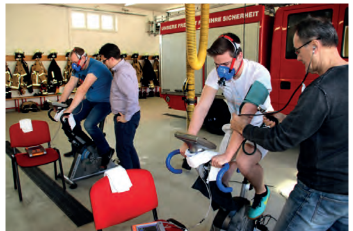
Auf dem Fahrradergometer absolvieren Kameraden der Freiwilligen Feuerwehr Meitzendorf einen 20-minütigen Fitnessstest.

der Leistungsfähigkeit. Fazit: Alle Kameraden haben die konditionellen Anforderungen eines Atemschutzgeräteträgers erfüllt und erzielten in vielen Bereichen überdurchschnittlich gute Werte. skr