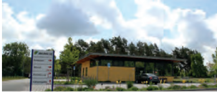
Das moderne Infozentrum ist zentraler Ort am Erholungscenter Jersleber See.

Basis einer geringfügigen Beschäftigung. Die maximale monatliche Arbeitszeit beträgt 34 Stunden. Interessenten sollten mindestens 18 Jahre alt sein, die Rettungsschwimmer darüber hinaus das Deutsche Rettungsschwimmerabzeichen Silber sowie eine Erste-Hilfe-Ausbildung haben.