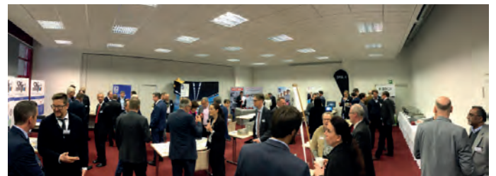
In der begleitenden Ausstellung wurden auch Aspekte der Fachkräftequalifizierung diskutiert und unternehmerische Kooperationen angeboten.