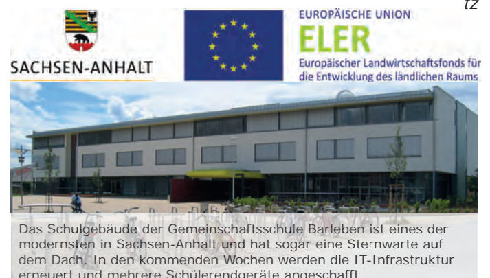
Das Schulgebäude der Gemeinschaftsschule Barleben ist eines der modernsten in Sachsen-Anhalt und hat sogar eine Sternwarte auf dem Dach. In den kommenden Wochen werden die IT-Infrastruktur erneuert und mehrere Schülerendgeräte angeschafft.