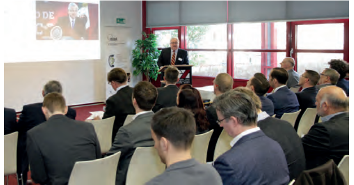
Der mexikanische Botschafter stellte das Gastland Mexiko vor. Das lateinamerikanische Land ist ein Exportland und dies nicht nur mit Exporten in die USA. In Mexiko wird beispielsweise der Audi Q5 gefertigt.