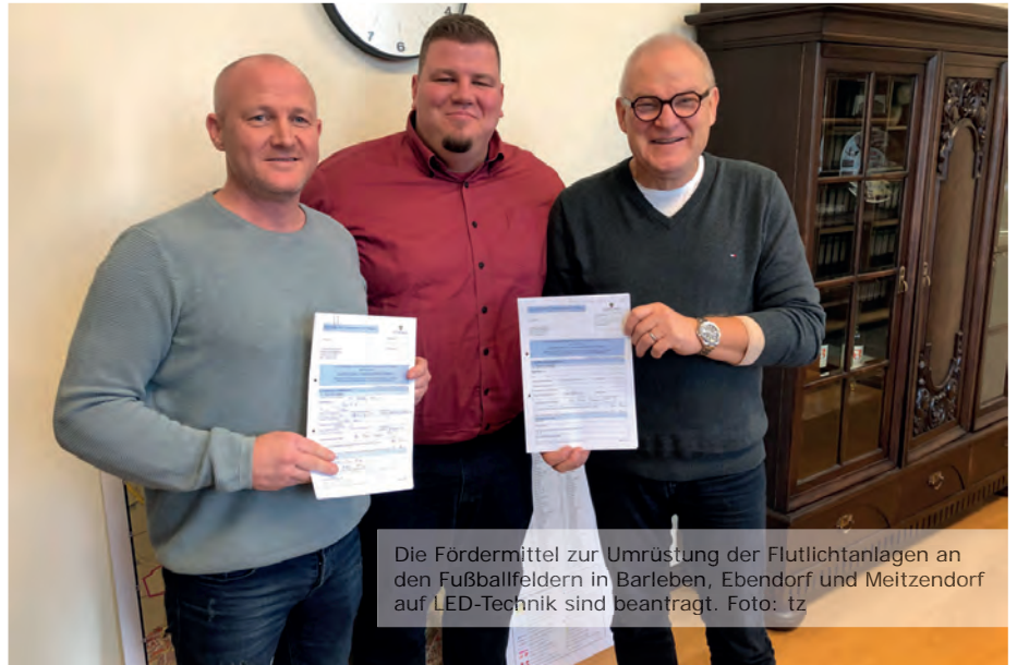
Die Fördermittel zur Umrüstung der Flutlichtanlagen an den Fußballfeldern in Barleben, Ebendorf und Meitzendorf auf LED-Technik sind beantragt.

Eine willkommene Gelegenheit für die beiden Sportvereine. Die Flutlichtanlagen an den Fußballfeldern in Ebendorf, Barleben und Meitzendorf könnten somit von energieverbrauchintensiven HQL-Lampen auf energieeffiziente LED-Leuchtmittel umgerüstet werden. Die modernen LED-Lampen haben gleich mehrere Vorteile. Zum einen lassen sich die