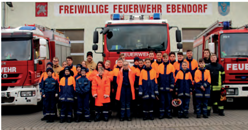
Aufstellung der drei Jugendfeuerwehren der Ortschaften vor der Feuerwehr in Ebendorf.

>> Für die Heranwachsenden der Jugendfeuerwehren Barleben, Ebendorf und Meitzendorf stand kürzlich der erste Gemeinschaftstermin an: Das alljährliche Angrillen. Dabei galt es in gemischten Gruppen Aufgaben zu bewältigen, welche die Kameradschaft fördern. Nach der