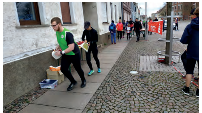
Beim Orientierungslauf werden mit Hilfe von Karte und Kompass mehrere Kontrollpunkte (Posten) im Gelände der Reihe nach abgelaufen.