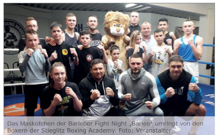
Das Maskotchen der Barleber Fight Night „Barleo“ umringt von den Boxern der Stieglitz Boxing Academy.