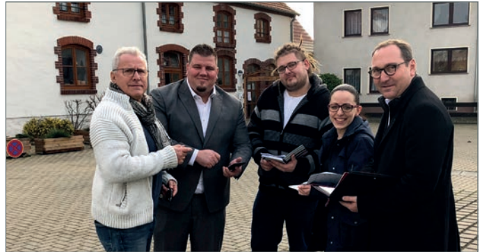
Auf dem „Alten Schulhof“ in Meitzendorf soll im April ein Streetfood Festival stattfinden.