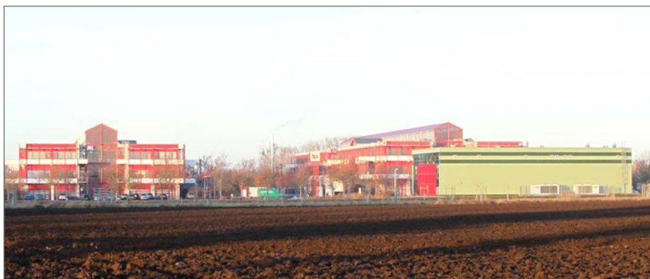
Im Technologiepark Ostfalen im direkten Umfeld des „Innovations- und Gründerzentrum“ (IGZ) und des „Institut für Kompetenz in AutoMobilität“ (IKAM) wird das neue Forschungszentrum „Center for Method and Development“ (CMD) entstehen.

wird es künftig mehrere Prüfstände und Labore für Elektro-, Wasserstoff- und Hybridantriebe geben. So soll etwa das Betriebs- und Alterungsverhalten von Batterien und Batteriemodulen untersucht werden. Im künftigen Brennstoffzellen-System-Labor soll es darum gehen, das komplexe Brennstoffzellensystem im Auto inklusive Luftversorgung und Wassermanagement zu optimieren. Zunächst werden etwa 20 Arbeitsplätze für hochqualifizierte Mitarbeiter geschaffen. Weitere Arbeitsplätze werden voraussichtlich durch industrielle Partner entstehen, die mit dem CMD Forschungs- und Entwicklungsprojekte vorantreiben wollen. Erste Absichtserklärungen mit international tätigen Entwicklungsdienstleistern für Automobilkonzerne wurden bereits unterzeichnet. Aktuell werden 270 Unternehmen mit rund 26.000 Beschäftigten der Automotive-Branche in Sachsen-Anhalt zugerechnet. Der Ort für die Errichtung des CMD-Forschungszentrums wurde mit Bedacht gewählt. Bereits im Technologiepark ansässig ist neben dem Institut für Kompetenz in