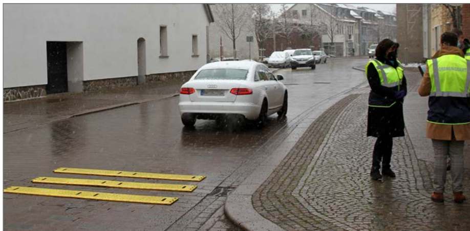
Die Gemeinde Barleben testet derzeit den Einsatz mobiler Fahrbahnschwellen. Ist der Einsatz praktikabel und wird tatsächlich eine Verkehrsberuhigung erreicht, sollen im kommenden Jahr mehrere dieser Bremsschwellen angeschafft werden.

Die mobilen Fahrbahnschwellen sollen zum Beispiel vor Kindereinrichtungen und Schulen sowie in Straßen mit hohem Verkehrsaufkommen eingesetzt werden. Derzeit läuft eine mehrwöchige Testphase, in der die Anwendung der Fahrbahnschwellen in der Praxis ausprobiert wird. Dafür haben Mitarbeiter des Wirtschaftshofes die auffällig gelben Bremsschwellen