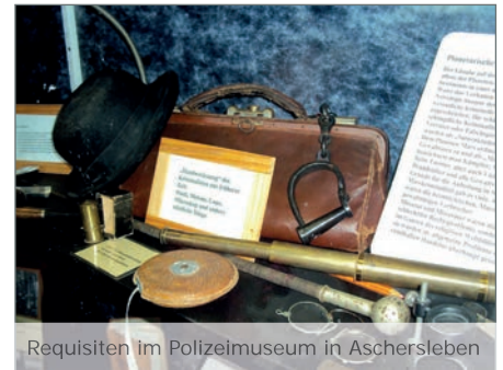
Requisiten im Polizeimuseum in Aschersleben