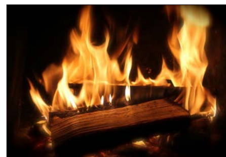
Es darf nur Holz im Ofen landen, dessen Wassergehalt bei maximal 20 Prozent beziehungsweise dessen Feuchtegehalt bei rund 25 Prozent liegt.

Ein weiterer Grund für schlechte Verbrennung ist zu feuchtes Holz. Daher dürfen nie frisch geschlagene Scheite verbrannt werden - das ist sogar gesetzlich geregelt und es drohen Bußgelder bei Nichteinhaltung. Es darf nur Holz im Ofen landen, dessen Wassergehalt bei maximal 20 Prozent beziehungsweise dessen Feuchtegehalt bei rund 25 Prozent liegt. Dies lässt sich mit einem