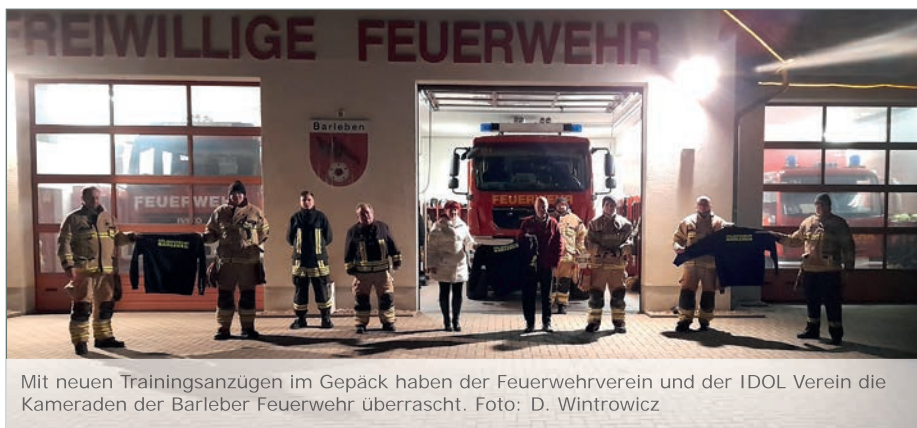
Mit neuen Trainingsanzügen im Gepäck haben der Feuerwehrverein und der IDOL Verein die Kameraden der Barleber Feuerwehr überrascht.

Wir bedanken uns ganz herzlich bei unserem Feuerwehrverein und dem IDOL Verein Barleben für die Unterstützung. Nach der Geschenkübergabe gingen wir zum Ausbildungsdienst über. Auf dem Plan stand die Überprüfung unserer gesamten Einsatztechnik auf ihre Funktion. (FFW Barleben/D. Wintrowicz)