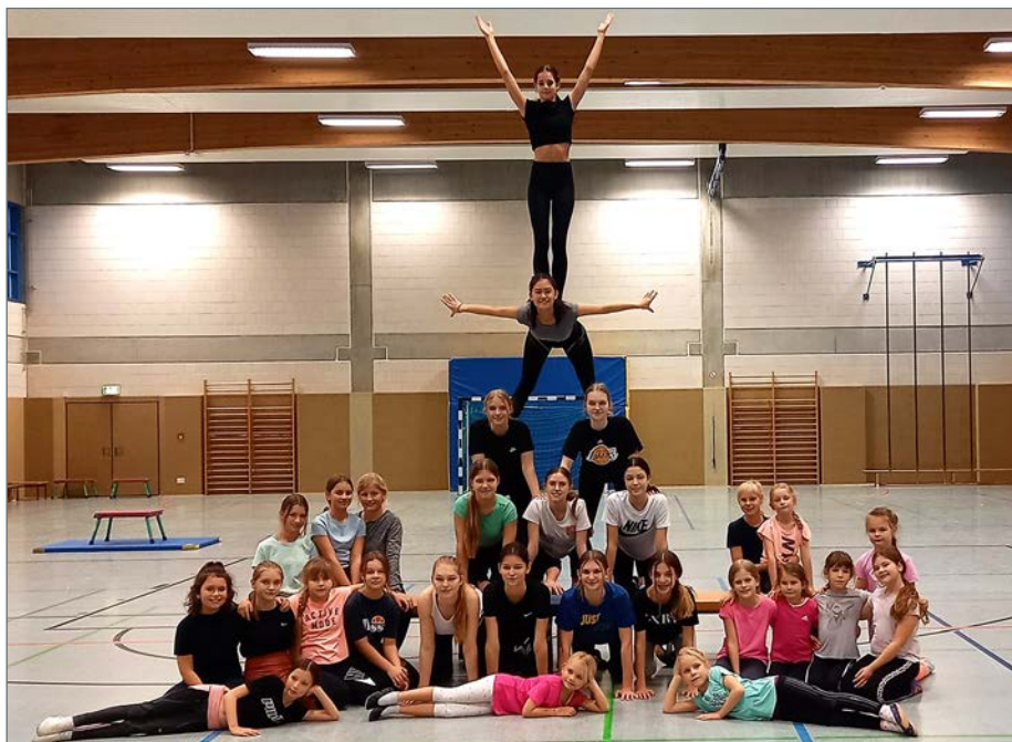
Die Artistinnen zeigen, dass sie nichts verlernt haben und formieren sich bei ihrem Training zu einer großen Pyramide.

Bleibt zu hoffen, dass das Ensemble bis zum 30-jährigen Jubiläum in drei Jahren an die alten Glanzzeiten mit über 50 Auftritten im Jahr und den Angeboten in über 30 Kursen anknüpfen kann. (OK-Live/R. Malsch)