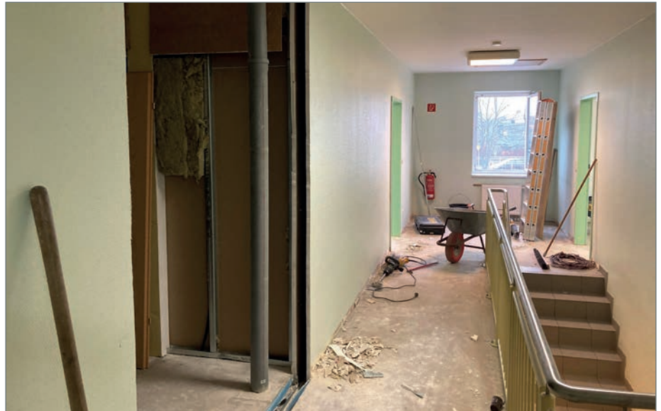
Die Gemeinde Barleben lässt derzeit das Dachgeschoss des Bürgerhauses in Ebendorf komplett umbauen. Hier entstehen Räumlichkeiten für einen Kinder- und Jugendclub.

Die Errichtung des Kinder- und Jugendclubs in Ebendorf wird gefördert mit Mitteln aus dem Europäischen Landwirtschaftsfond zur Entwicklung des ländlichen Raumes (ELER). Die Gesamtausgaben für den Um- und Ausbau des Dachgeschosses des Bürgerhauses Ebendorf sind mit rund 220.000 Euro geplant. Die Zuwendung durch den Fördermittelgeber beträgt rund 142.000 Euro. (tz)