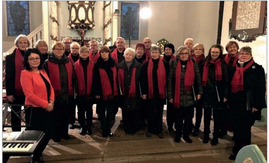
Der Chor „Concordia Barleben e. V.“ bei seinem letzten Weihnachtskonzert in der Kirche St. Peter und Paul in Barleben.

>> Aus gegebenem Anlass möchte der Vorstand des Chores alle Bürger der Gemeinde darüber informieren, dass sich der Chor „Concordia Barleben e. V.“ mit Wirkung vom 01.01.2022 aufgelöst hat. Nach Prüfung der Chorsituation, die durch fehlende Proben seit März 2020, aufgrund der Altersstruktur und gesundheitlicher Probleme einiger Mitglieder sowie durch die Einschränkungen wegen der Pandemie maßgeblich bestimmt wird, ist keine Perspektive für einen qualitativ anspruchsvollen mehrstimmigen Chorgesang mehr erkennbar. Der Chor hat sich in seiner langjährigen Existenz, ob als Männerchor oder gemischter Chor, ein hohes Ansehen erarbeitet. Bei vielen Auftritten in Barleben und Umgebung beispielsweise in Pflegeheimen, in Kirchen und bei lokalen Festlichkeiten hat er es immer wieder bewiesen. Drei Pokale, die in Wettstreiten mit vielen anderen Chören errungen wurden, sprechen für sich. Die Adventskonzerte gemeinsam mit dem Posaunenchor in der Barleber Kirche sollen hier nicht unerwähnt bleiben. Besonders in den letzten Jahren stellten sie einen Höhepunkt