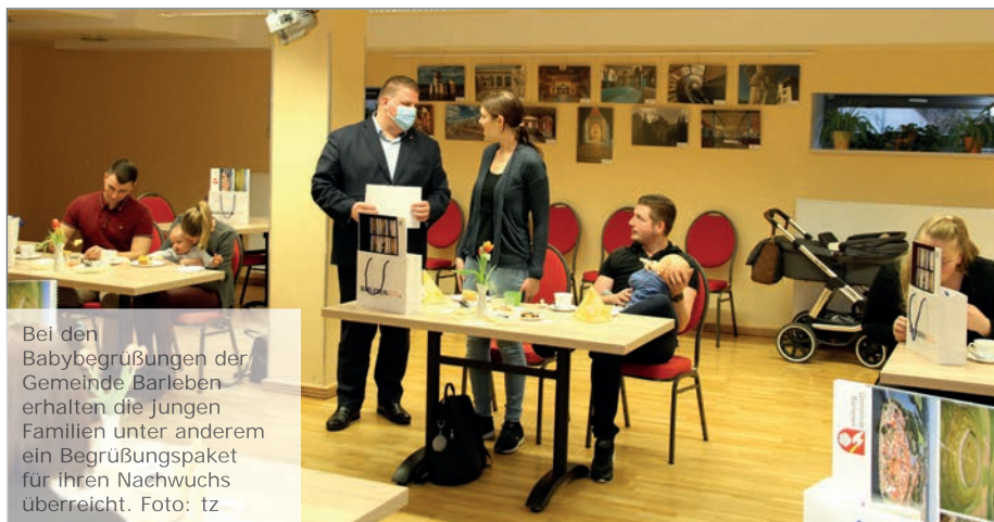
Bei den Babybegrüßungen der Gemeinde Barleben erhalten die jungen Familien unter anderem ein Begrüßungspaket für ihren Nachwuchs überreicht.

Für die gemütliche Atmosphäre bei der Babybegrüßung sorgten der LiBa e. V. und der MGZ e. V. mit selbstgebackenem Kuchen sowie Kaffee und Tee. (tz)