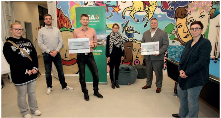
Mit je 1.635 Euro unterstützt die Gemeinde Barleben die Arbeit des Kinderfördervereins Ebendorf und des Kinder- und Jugendfördervereins Barleben.

Der Kinder- und Jugendförderverein Barleben wird das Geld zu gleichen Teilen den Kindereinrichtungen in Barleben zu Gute kommen lassen. „Wir fragen ab, welchen Bedarf die