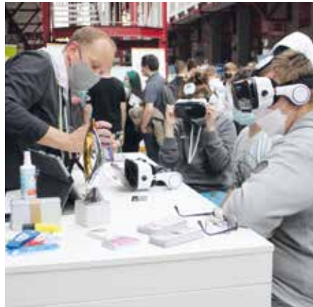
KickStart im IGZ: Die Zukunft bestand auch 2021 schon aus „Virtual Reality“

Interessant: Seit nunmehr 13 Jahren wird diese wichtige Ausbildungs-Messe für unsere Kinder vom Bildungswerk der Wirtschaft Sachsen-Anhalt (BWSA) e.V., in Kooperation mit den Arbeitgeberverbänden im Haus der Wirtschaft und dem Netzwerk Schulewirtschaft Sachsen-Anhalt organisiert.