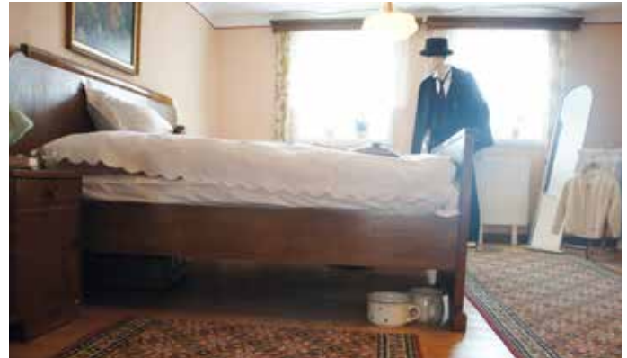
Das Schlafzimmer mit Federbetten, Zierdecken, einem großen Spiegel und dem unverzichtbaren Nachtschiff für die Herrschaften.