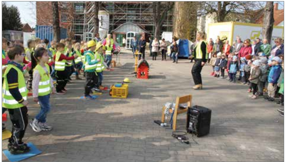
Mit einem Programm aus Liedern und Gedichten haben Kinder aus dem Barleber Kindergarten und dem Hort das Richtfest eröffnet.