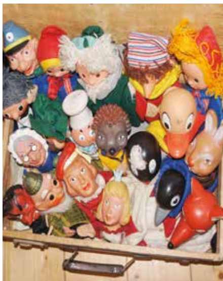
Alte Kasperlefiguren, das Schnatterinchen und Pittiplatsch – die Vergangenheit wird jung im Heimatmuseum Barleben.

ist aber auch „die Pflege der plattdeutschen Sprache“ (siehe nächste Seite). Ein weiterer Glanzpunkt des Heimatvereins sind die Ortsführungen, die durch Corona die letzten Jahre ausfielen. Jedes Jahr widmet sich die Führung einem anderen Thema, zum Beispiel alten Fabriken, vergessenen Gasthäusern oder dem Breitweg, an dem auch die Heimatstube liegt.