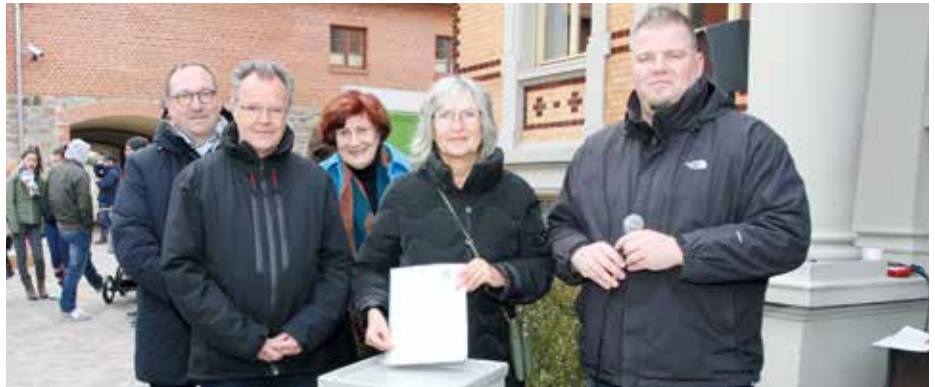
Mit einer Charity-Aktion hat die Gemeinde Barleben knapp 8.500 Euro für die befreudete Gemeinde Shyroke in der Ukraine gesammelt. Mit 1.000 Euro beteiligte sich auch der Lions Club Börde an der Aktion.

„Ich möchte mich ausdrücklich auch bei den Unternehmen bedanken, die sich an unserer Charity-Aktion beteiligt haben“, so der Bürgermeister. So haben beispielsweise die Löwen-Apotheke und die Arztpraxis Novak vierstellige Geldbeträge auf das Spendenkonto der Gemeinde Barleben überwiesen. Die Bäckerei Möhring, die Beims Bäckerei, die Aldi Meitzendorf GmbH und