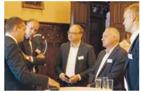
Beim Zukunftsforum in der Magdeburger Toepffer-Villa waren Unternehmer und Politik zusammengekommen, um gemeinsam neue Impulse zu Finanzierungsmöglichkeiten zu geben und zu bekommen.