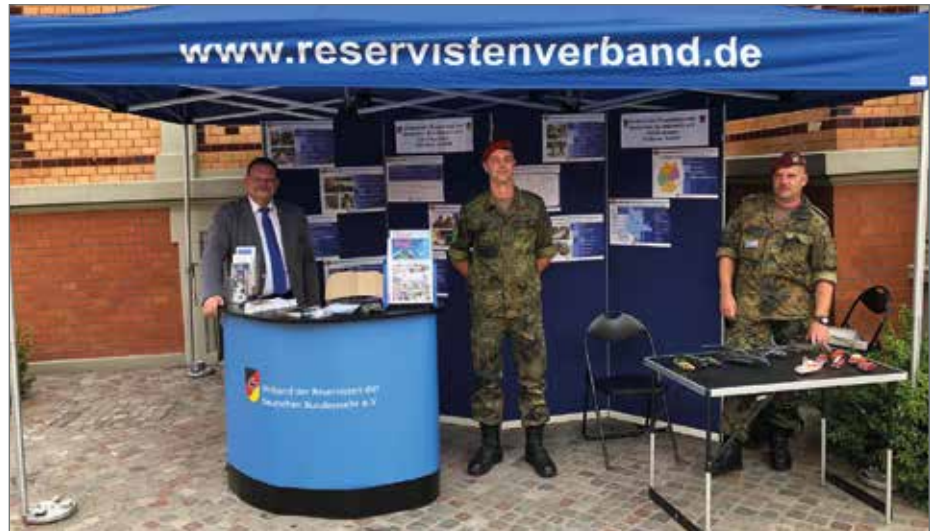
Auch die Bundeswehr kommt zum Blaulichttag.

Auch die Landesverkehrswacht beteiligt sich wieder und bringt u.a. ihren „Schlitten“ zur Simulation von Auffahrunfällen mit. Vor Ort werden zudem die Bundespolizei, das Innenministerium und die örtlichen Regionalbereichsbeamten vertreten