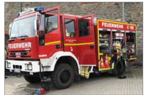
Die Freiwillige Feuerwehr stellt ihre Arbeit beim Blaulichttag vor.

Mit dem Blaulichttag geht es den Veranstaltern auch darum, dass Bürgerinnen und Bürger mit den