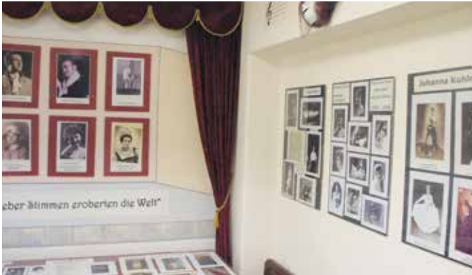
Der Raum berühmter Barleber Sängern und Sänger. Interessant, wer aus der Altmark die Bretter, die die Welt bedeuten, eroberte.