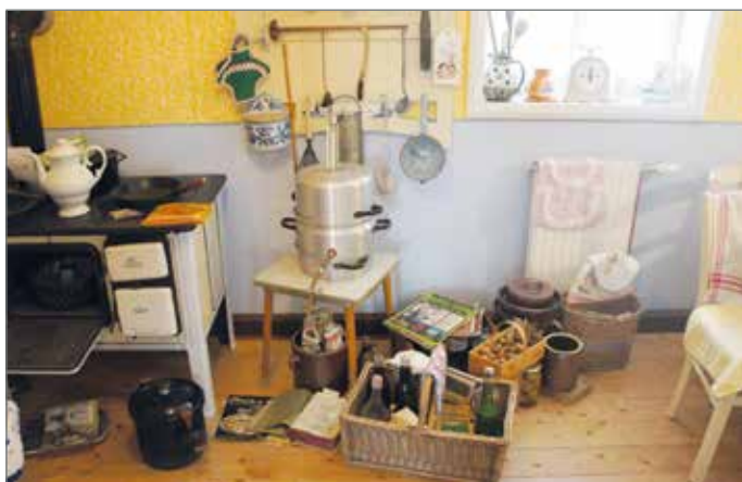
Die alte Küche mit Kohleherd, geklöppelten Deckchen, Aluminium-Kochgeschirr, Porzellan, alten Gerätschaften und vielem mehr.