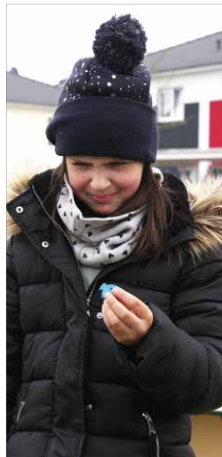
Die fleißigen Kinder der Umwelt-AG finden die verschiedensten Dinge, Müll ist es aber doch!