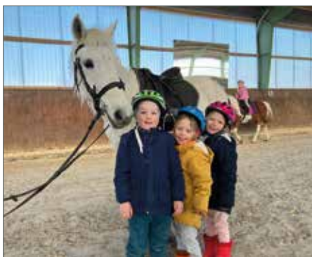
Beim Adventsmarkt rund um die Reithalle können Kinder Ponys reiten.

Wenn Sie sich für den Hundesportverein Ebendorf interessieren, schreiben Sie einfach eine Mail an schrieber.h@googlemail.com oder schauen an einem Samstag ab 15 Uhr auf dem Platz am Schnarsleber Weg vorbei. (tp)