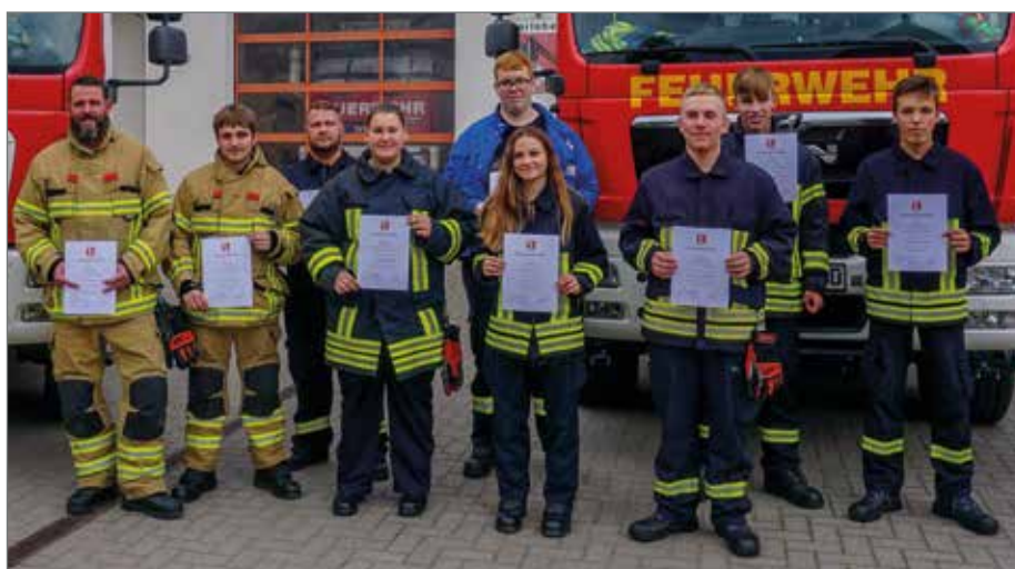
Die Absolventen des Lehrgangs zeigen stolz ihre Urkunden.

>> Anfang Oktober wurde es für die 19 Teilnehmer des diesjährigen Grundlehrgangs für die Freiwilligen Feuerwehren ernst. Die Abschlussprüfung stand an. Die Prüfung wurde in drei Teile aufgeteilt, im ersten Teil stand ein schriftlicher Leistungsnachweis an. Der zweite Teil gliederte sich in Fahrzeug- und Gerätekunde und in Knotenkunde. Hier mussten die Prüflinge verschiedene Gerätschaften zeigen und erklären sowie Feuerwehrrknoten binden und erklären. Den dritten und letzten Teil bildete eine praktische Einsatzübung nach der Feuerwehrdienstvorschrift 3 „Die Gruppe im Löscheinsatz“. Nach dem Mittagessen wurde dann für alle das erlösende Ergebnis bekanntgegeben. Alle 16 Männer und 3 Frauen haben den Lehrgang erfolgreich bestanden. Wir gratulieren allen Teilnehmern ganz herzlich. Besonders zu erwähnen ist, dass sich in diesem Jahr viele Quereinsteiger der Herausforderung „Grundlehrgang“ gestellt haben. Dieser Lehrgang ist der wohl zeitintensivste Lehrgang in der Feuerwehr, jedoch von enormer Wichtigkeit. Denn nur so kann den Teilnehmern das Grundwissen für