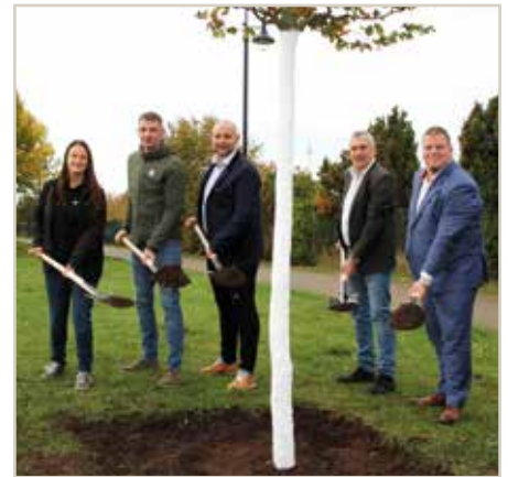
Anlässlich des Firmenjubiläums wurde im Olvenstedter Weg in Barleben eine Rotbuche gepflanzt.

Bei dem Baum handelt es sich um eine Rotbuche ( Fagus sylvatica ). Die Rotbuche ist der „Baum des Jahres 2022“. Sie symbolisiert den Zwiespalt zwischen Verzweiflung und Hoffnung in der Klimakrise. Mit inzwischen insgesamt ca. 270 Mitarbeitern an den genannten drei Standorten ist die Haltern und Kaufmann GmbH & Co. KG in nahezu allen Bereichen des Garten-, Landschafts- und Sportplatzbau tätig.