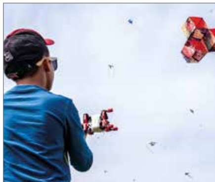
Reichlich Drachen flogen beim Fest am Schnarsleber Weg.

An über zehn Ständen boten Kinder und Eltern nicht mehr passende oder benötigte Kleidung, Spielwaren und Sonstiges aus Dachboden und Kinderzimmern an und konnten durch fleißige Käufer ihr Taschengeld aufbessern. Auf dem anliegenden Bolzplatz ließen kleine und große Drachenpiloten die schönsten Fluggeräte fliegen. Wer keinen eigenen Drachen dabei hatte, konnte sich am Stand von Mitarbeiterinnen der KITA Ebendorf einen eigenen basteln und gestalten. Ein weiteres Highlight und einer der am meisten besuchten Stände an diesem Nachmittag war