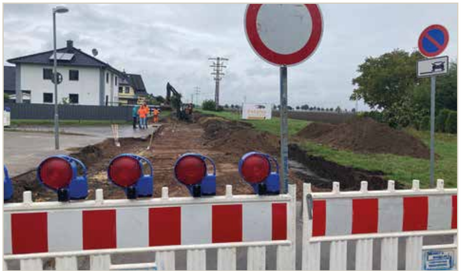
Die "Siedlung" am Meitzendorfer Ortsrand wird grundhaft ausgebaut. Dies ist der erste Straßenausbau, der ohne Anwohnerbeiträge durchgeführt wird.

>> Holpriges Kopfsteinpflaster, enger Begegnungsverkehr, keine Straßenbeleuchtung und ein fehlender Gehweg. Der Zustand der Straße „Siedlung“ in der Ortschaft Meitzendorf war bislang alles andere als gut. Damit ist jetzt Schluss. Die Gemeinde Barleben ist hier in Aktion getreten und lässt die Straße am Ortsrand grundhaft ausbauen. Auf einer Länge von rund 120 Meter werden der Straßenunterbau, der Fahrbahnbelag sowie ein straßenbegleitender Gehweg hergestellt und Straßenlampen aufgestellt. Die Baumaßnahme läuft bereits seit einigen Wochen und soll Mitte November abgeschlossen sein. Die Gemeinde Barleben investiert hierfür rund 195.000 Euro inklusive 25.000 Euro Planungskosten. „Mit dem Ausbau dieser Straße machen wir auch deutlich, dass wir nicht nur die Infrastruktur in Barleben im Blick haben“, sagt Bürgermeister Frank Nase. Die Baumaßnahme ist das erste Straßenbauprojekt, das die Gemeinde ohne Beteiligung der Anwohner, also ohne die Erhebung von Straßenausbaubeiträgen realisiert.