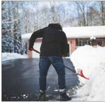
Straßenreinigungs- und Schneeräumpflicht besteht nach gesetzlichen Regeln.

Es wird diesbezüglich darauf hingewiesen, dass Kehricht und sonstiger Unrat nach Beendigung der Säuberung durch den Ausführenden unverzüglich und eigenverantwortlich einer ordnungsgemäßen Entsorgung zuzuführen sind. Im Übrigen gehört die Beseitigung des Laub- und Fruchtabwurfes von Bäumen und Sträuchern im Herbst ebenso zur Straßenreinigungspflicht.