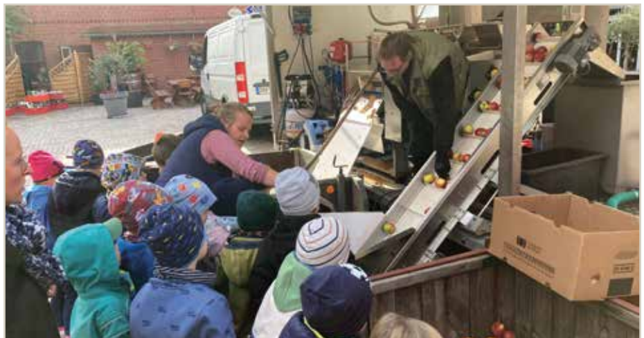
Bei einem Aktionstag auf dem Hof der Mittellandhalle in Barleben konnten Vorschulkinder erleben, wie aus Äpfeln Saft gemacht wird.

„Wir wollen den Kindern auf ganz anschauliche Weise zeigen, dass der Apfelsaft nicht einfach nur aus der Flasche aus dem Supermarkt kommt, sondern dass da vorher etwas