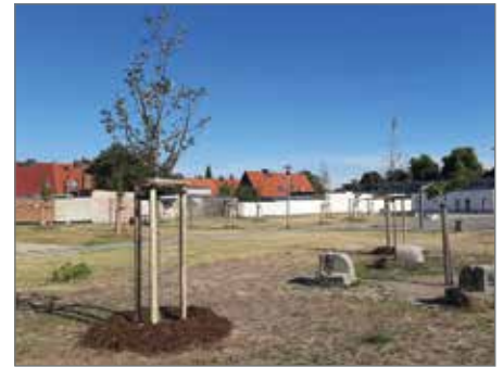
Eine neue Turnhalle entsteht (links), dazu ein Campuswäldchen (rechts).

Die ersten Ergebnisse sind schon sichtbar: Auf dem Schulhof des Gymnasiums nimmt das „Campuswäldchen“ mehr und mehr Gestalt an. Die Stiftung möchte an dieser Stelle den verschiedenen „Baumpaten“ danken, ohne deren Unterstützung dieses Projekt nicht möglich gewesen wäre. Die realisierenden Gartenbaubetriebe kommen selbstverständlich aus der Region.