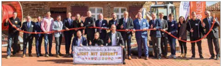
Die Bürgermeister der acht Mitgliedsgemeinden der ARGE-Breitband aus dem Landkreis Börde, Vertreter des Konzessionärs „DNS:NET“ und des Fördermittelgebers des Bundes „pwc-TÜV“ trafen sich in Hundisburg zur Breitbandtagung, um eine Zwischenbilanz für das Großprojekt zu ziehen. In der Gemeinde Barleben sind bisher rund 41 Kilometer Kabel verlegt und mehrere hundert Glasfaseranschlüsse aktiv.

In der Ortschaft Barleben sind mit 253 aktiven Glasfaseranschlüssen derzeit etwas mehr als ein Viertel der 991 Verträge realisiert. Vor allem im nördlichen Barleben (Ammensleber Weg, Agrarstraße) sowie in dem Wohngebiet östlich des „Hotel Sachsen-Anhalt“ kann das ultraschnelle Breitband im privaten Bereich mit Geschwindigkeiten von bis zu 500 MBit/s Download sowie 50 MBit/s im Upload genutzt werden.