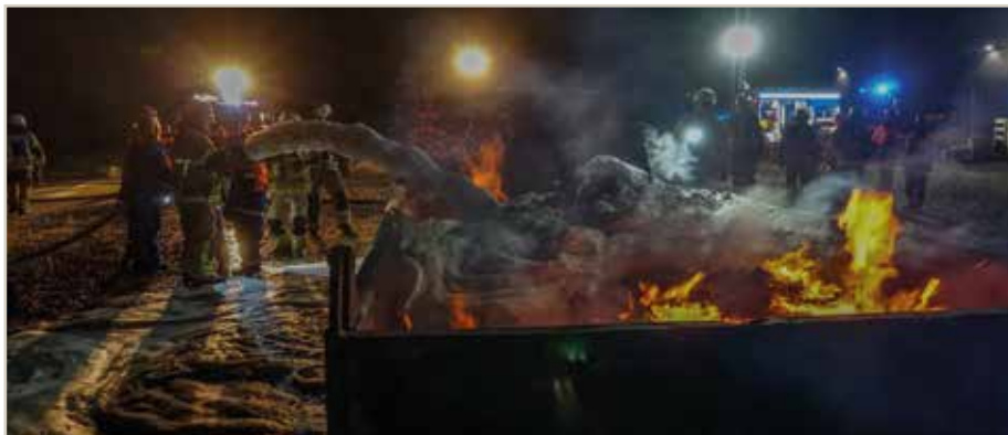
Mit der Schaumkanone konnten die Mitglieder der Jugendfeuerwehr den brennenden Container löschen.

Und nach dem Mittagessen dann der Alarm. Schnell wurden Schläuche verlegt, ein Behandlungsplatz für die Verletzten aufgebaut und Trupps in die vernebelten Räume geschickt. Ein Verletzter nach dem anderen - insgesamt über 20 - wurde gerettet und anschließend durch die Jugendlichen versorgt. Eine wahre Materialschlacht, aber die