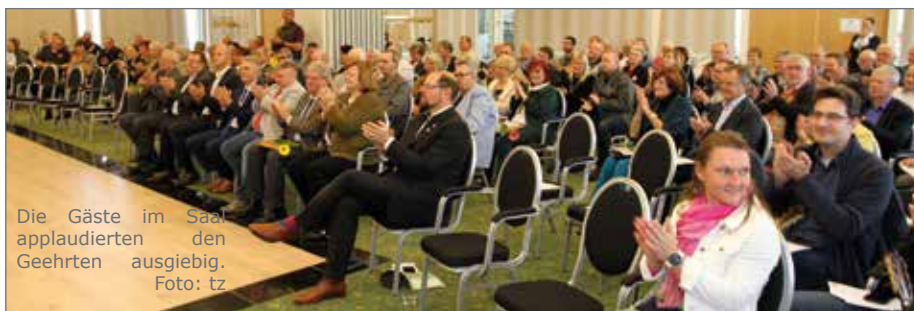
Die Gäste im Saal applaudierten den Geehrten ausgiebig.