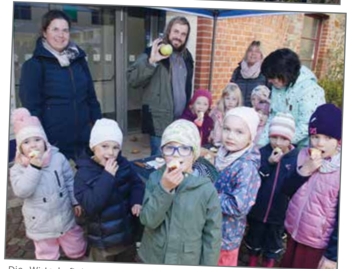
Die Wirtschaftsjuvenoren der Börde haben im Oktober dafür gesorgt, dass Kinder aus den Kindertagesstätten „Barleber Schlümpfe“ und „Gut Arnstedt“ in Barleben, „Gänseblümchen“ in Ebendorf und „Birkenwichtel“ Meitzendorf auf dem Hof der Mittellandhalle zuschauen konnten, wie aus ihren mitgebrachten Äpfeln in der mobilen Saftpresse leckerer Saft gepresst wurde. Sie konnten auch Äpfel und Saft gleich vor Ort testen.