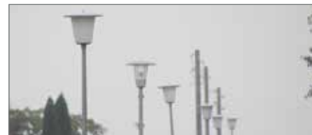
Defekte Straßenlampen können bei der Gemeinde gemeldet werden.