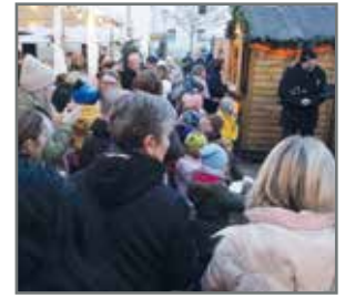
Die Organisatoren der Weihnachtsmärkte bereiten schon die Feste vor.