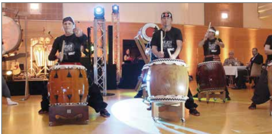
Taiko-Trommler in voller Aktion bei einer festlichen Veranstaltung.

Taiko ist eine traditionelle japanische Form des Trommelns, die sowohl musikalisch als auch kulturell tief verwurzelt ist. Taiko-Trommeln können in verschiedenen Formen und Größen vorkommen, aber sie haben typischerweise eine tiefe, runde Form mit einem Durchmesser von einem Meter oder mehr. Sie werden aus Holz und Tierhäuten hergestellt, wobei die häufigsten Tierhäute, die für die Trommelmembranen verwendet werden, von Rindern stammen. Diese Drums sind nicht nur Musikinstrumente, sondern auch Ausdrucksmittel für Emotionen, Geschichten und Traditionen. Die Taiko-Gruppe für die Erwachsenen mit dem Namen „Higashi Daiko“ gibt es schon lange. Damals hatte die Gemeinde Barleben den „Hatsuun Jindo“-Karate-Club Magdeburg-Barleben mit Geld unterstützt, damit der Verein die ersten Taikos anschaffen konnte. Jetzt gibt es auch eine Gruppe für Kinder und Jugendliche, die montags von 16 bis 18 Uhr am Taikostützpunkt hinter dem Magdeburger Florapark, Lerchenwuhne 125, trainiert. „Wir freuen uns,