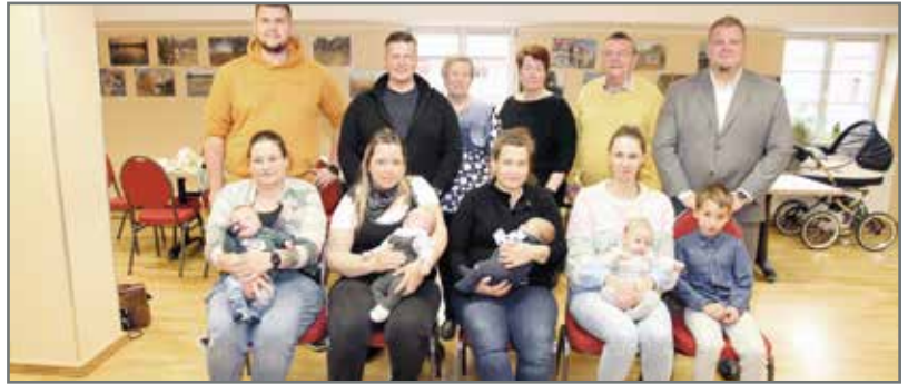
Veranstaltungen für Jung und Alt - von der Babybegrüßung über Vorführungen der Jugend bis zum Volksfest.