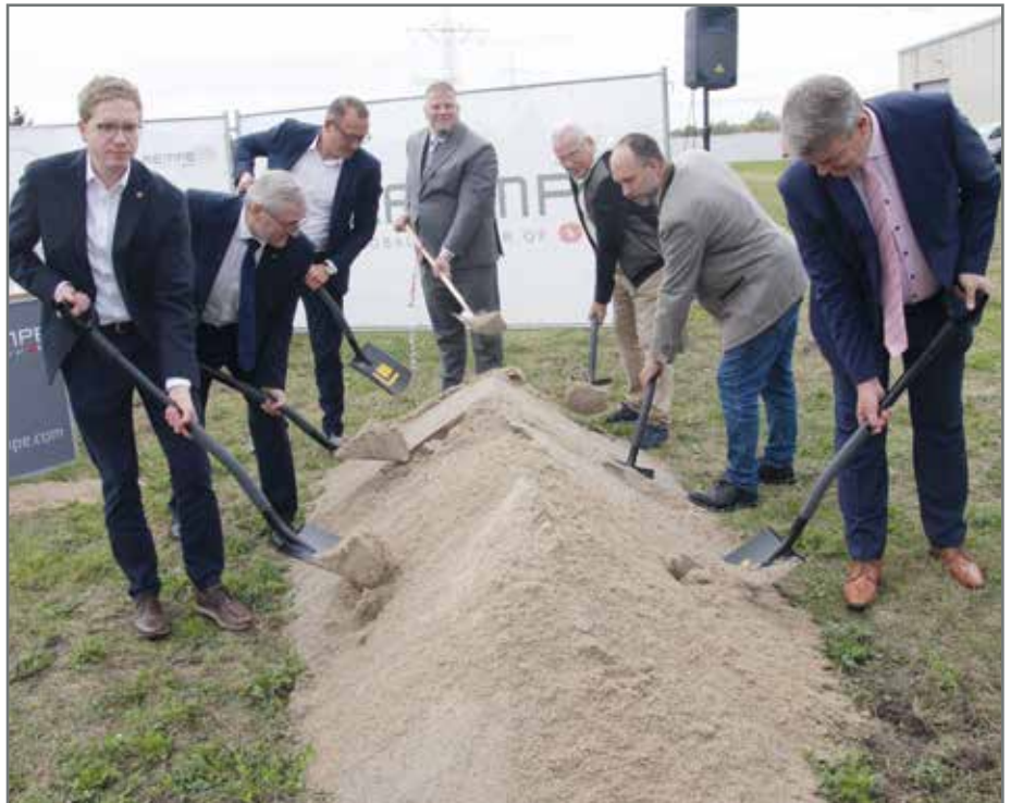
Beim symbolischen Spatenstich auf dem Unternehmens-Gelände in Meitzendorf griffen Vertreter der Baufirmen, der Politik und aus dem Unternehmen zum Spaten.