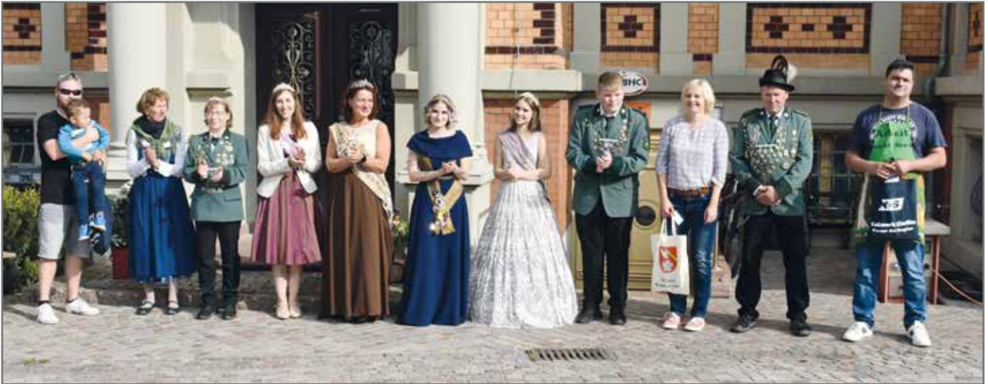
Gemeinsam mit den Majestäten stellten sich die Gewinnerinnen und Gewinner der Wettbewerbe fürs Foto aus.