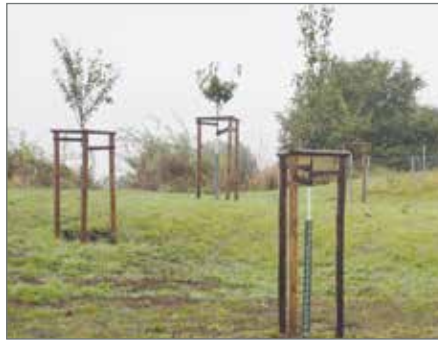
Bäume prägen das Ortsbild. Ab sofort können Spenden erfolgen.

Mit einer Baumspende schafft der Spender eine wichtige Erinnerung für sich selbst und seine Angehörigen. Um dies zu unterstreichen, soll im Rahmen des Spendenbaumkonzeptes dem Spender die Möglichkeit eingeräumt werden, den Spendenbaum mit einer Plakette zu versehen, welche die Spender individuell gestalten und bestellen können. Hierbei sind lediglich einige Vorgaben wie Größe und Material zu beachten, um eine einheitliche