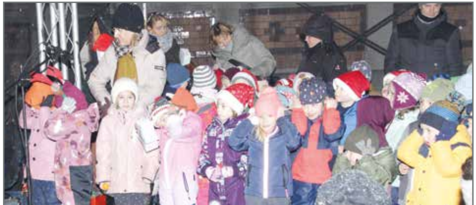
Besonders viel Freude gibt es beim Weihnachtsmarkt auf dem Hof der Mittellandhalle.

geleistet. Die Auslastungskapazität des MGZ stieg von 40 auf 80 Prozent. Monate wie der Oktober und der Dezember sind sogar komplett ausgebucht.