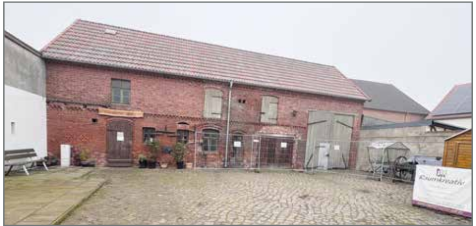
Der Ebendorfer Mühlenhof: Links ist der Eingang zur historischen Motormühle. Die Scheune rechts musste wegen Einsturzgefahr abgesperrt werden.