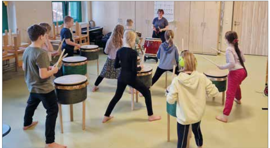
Unter fachkundiger Anleitung trainieren die Kinder an den Trommeln.

Nunmehr ist es so weit, schon seit dem 29. Januar trainieren Kinder ab 10 Jahren in den Räumlichkeiten des Horts der Ortschaft Barleben immer montags von 15 bis 16.30 Uhr. Die Kinder können sich drei Mal ausprobieren. Der HKC hat eigens dafür zehn Kindertaikos bauen lassen. Angeleitet wird das Training durch eine Fachübungsleiterin. Das Training in einer Kumi-daiko (Taiko-Gruppe) ist besonders förderlich für Kinder aus verschiedenen Gründen. Vor allem ermöglicht es ihnen, sich mit einer neuen Kultur, der japanischen Kultur, vertraut zu machen. Die dynamischen Klänge der Taiko-Trommel sind einzigartig und faszinieren durch ihre Kraft. Darüber hinaus trägt das regelmäßige Training zur Stärkung der Gesundheit, Ausdauer und