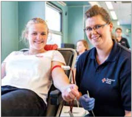
In Barleben ist das Blutspende-Team im April zu Gast.

Regelmäßige Blutspenden sind von lebensrettender Bedeutung, aber leider sind immer noch zahlreiche