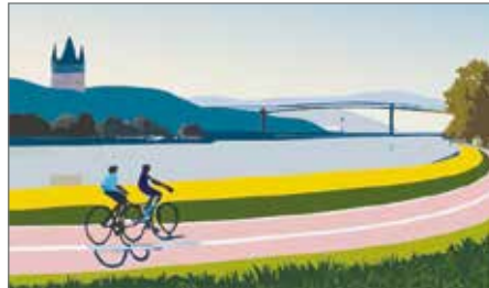
Der Elbe-Radweg ist Thema eines Vortrags in der Begegnungsstätte. Grafik: Amann

>> Am 9. April um 17 Uhr hält Wilfried Schliepharke in der Begegnungsstätte