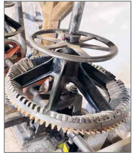
Das Mahlwerk der Motormühle. Der Stein vorne ist wieder intakt, die neuen Holzzähne sind gut zu erkennen.

Nach Vorstellungen des Vereins soll die Scheune saniert und wieder genutzt werden. Noch ist die Höhe der Summe nicht abzuschätzen. Auch wenn sie sicherlich in Teilen von der Gemeinde und durch Fördermittel finanziert wird, wird der Verein durch Eigenleistung und Geld mithilfe der alte Scheune zu neuem Leben zu erwecken. So wie bei der alten Mühle. Auch wenn das garantiert noch Jahre dauern wird, aber für Ebendorf sehr wichtig ist. Historisches muss erhalten werden, nicht nur für unsere Nachkommen. Wenn es gelingt, das gesamte Ensemble zu erhalten, dann behält der Mühlenhof sein für das alte Bauerndorf Ebendorf typisches geschlossene Grundstücksaussehen