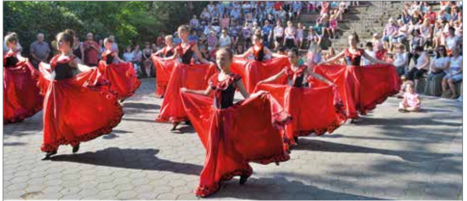
Die Auftritte der OK-Live-Tanzensembles sind immer ein künstlerischer und optischer Höhepunkt und gewannen schon einige Wettbewerbe.