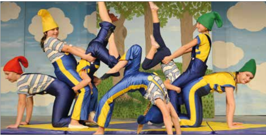
Die verschiedenen Artistengruppen bieten Artistik vom Feinsten und dürfen auch schon mal mit bekannten Bands die Bühne teilen.