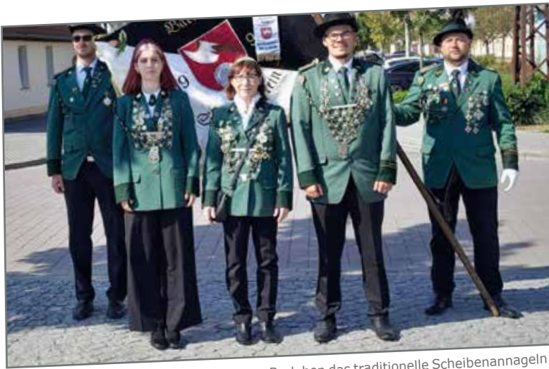
Vor einiger Zeit fand beim Schützenverein Barleben das traditionelle Scheibenannageln statt. Nach der Ermittlung der neuen Majestäten auf dem Schützenfest wurden die Königsscheiben in feierlichem Rahmen angebracht. Die Zeremonie begann beim Schützenkönig, führte weiter zur Königin und schließlich zur Jugendmajestät. Der Ablauf folgte dabei dem etablierten Protokoll: Der Vorsitzende bat an jedem Ort um Erlaubnis, die Scheibe an der Wand anzubringen. Anschließend ehrte das Salutkommando die Majestäten mit Ehrenschüssen. Nach einem kurzen Umtrunk wurde die nächste Station angesteuert. Zum Abschluss der Veranstaltung lud die Schützenfamilie zu einer Feier im Schützenhaus ein. Musik, Tanz sowie Speisen und Getränke sorgten für eine lebhaft und gesellige Atmosphäre.