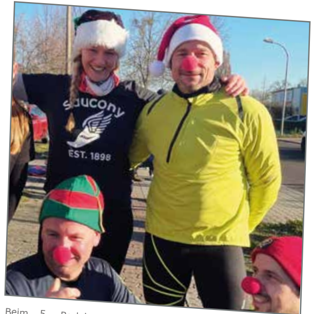
Beim 5. Barleber Adventslauf kamen Anfang Dezember beeindruckende 2.800 Euro an Spendengeldern zusammen! Der Lauf rund um den Neustädter See in Magdeburg war nicht nur eine wunderbare Gelegenheit, sportlich aktiv zu sein, sondern auch, um Gutes zu tun. Die Einnahmen gingen komplett an die Magdeburger Klinikclowns, die kranken Menschen ein Lächeln ins Gesicht zaubern. Als kleines Dankeschön bekamen alle Teilnehmenden liebevoll gestaltete Medaillen, die von den Kindern der Kita „Gut Arnstedt“ angefertigt wurden.