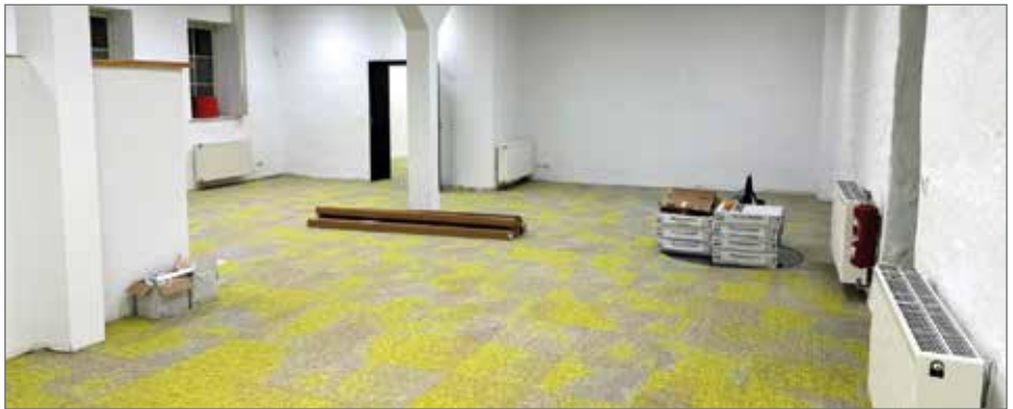
Die Bibliothek wird renoviert und voraussichtlich Mitte Januar wieder geöffnet.

>> Nichts steht mehr an seinem Platz. Die gesamte Bibliothek in Barleben ist leergeräumt. Seit Ende Oktober werden die Räumlichkeiten in der Ernst-Thälmann-Straße 3 umfangreich renoviert. Der neue Fußboden ist bereits verlegt. Die Wände haben einen neuen Anstrich bekommen. Dennoch konnte die Gemeindebibliothek nicht wie geplant am 6. Dezember wieder öffnen. Bis voraussichtlich Anfang Februar müssen die Kundinnen und Kunden noch warten. Bis dahin sollen die restlichen Handwerksarbeiten, das Aufbauen der Regale und das aufwendige Einsortieren der mehr als 15.000 Medien abgeschlossen sein.