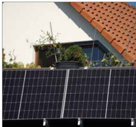
Für die Anschaffung und Installation eines Balkonkraftwerk kann die Gemeinde Barleben einen Zuschuss gewähren.

Gefördert werden Balkonkraftwerke mit einer Mindestleistung von 300 Watt, die die gesetzlichen Anforderungen erfüllen und in Deutschland frei erhältlich