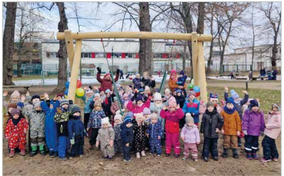
Die Kinder der Kita Gut Arnstedt freuen sich sichtlich über die neue Schaukel auf dem Außengelände der Einrichtung.

Gute Nachrichten - die Schaukel konnte sogar zeitnah aufgrund guter Wetterverhältnisse noch im letzten Jahr aufgebaut werden. Nach einer Trockenzeit von drei Wochen konnten wir sie dann im neuen Jahr endlich einweihen. Alle Kinder