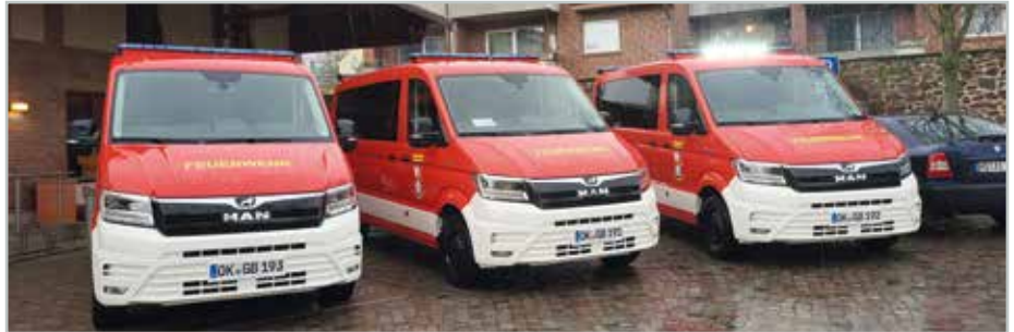
Die Feuerwehren in Barleben, Ebendorf und Meitzendorf können sich über neue Mannschaftstransportfahrzeuge freuen.

Die Fahrzeuge sind entsprechend der Anforderungen der Feuerwehr konfiguriert worden. Sie bieten Platz für bis zu acht Kameradinnen und Kameraden sowie ausreichend Platz für Ausrüstung. Durch moderne Sicherheits- und Kommunikationssysteme wird die Einsatzbereitschaft der Feuerwehren weiter optimiert. Zudem verfügen die Fahrzeuge über leistungsstarke Motoren, die auch in schwierigen Geländen eine zuverlässige Fortbewegung ermöglichen. Die Mannschaftstransportfahrzeuge sind wichtiger Bestandteil eines Einsatzzuges und dienen dazu, die Kameraden schnell an die Einsatzstelle zu bringen. Aber auch für Übungseinsätze