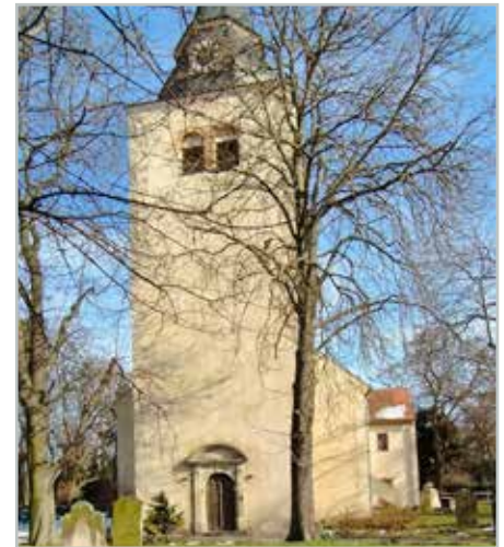
Auch an der Barleber Kirche will die Kirchengemeinde Frühjahrsputz machen.

>> Helfende Hände werden gesucht für den diesjährigen Frühjahrsputz der evangelischen Kirchengemeinde: In Ebendorf wird am 15. März ab 9 Uhr geharkt, gefegt und aufgeräumt. In Barleben ist die Aktion für Sonnabend, 5. April, ab 9 Uhr angesetzt. Was steht an? Flächen abharken, Beete herrichten, Laub und Geäst in Container laden und vieles mehr. Mitzubringen sind gute Laune, geeignete Gartengeräte, Handschuhe ... Es wäre toll, wenn sich Menschen finden, die bereit sind, Frühjahrsputz in unseren Gemeinderäumen zu leisten, eventuell auch die Fenster zu putzen! Danke schon jetzt an alle, die uns Jahr für Jahr unterstützen und herzlich willkommen allen, die für sich entscheiden: Ja, ich bin auch dabei! Übrigens: Alle Helfenden sind versichert. (Ute Lüder/aa)