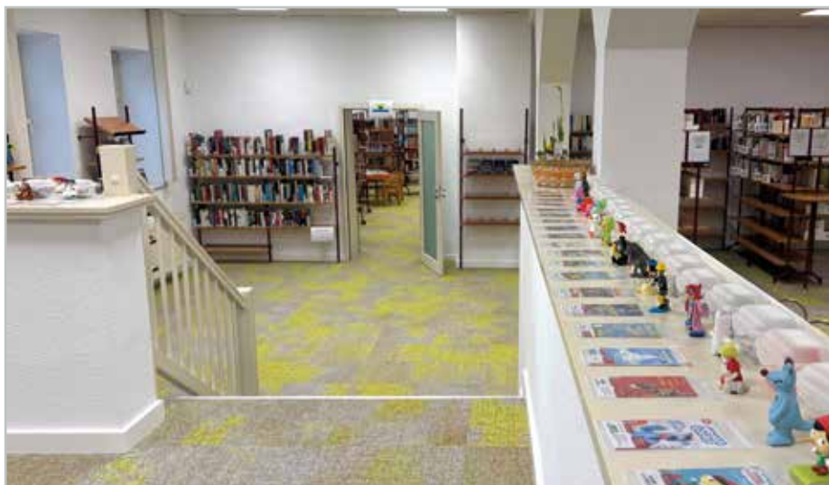
Die Bibliothek in Barleben ist nach den umfangreichen Renovierungsarbeiten seit Anfang Februar wieder geöffnet.

Das schafft Platz für neue Literatur: In den kommenden Wochen werden zahlreiche aktuelle Titel und Neuerscheinungen ins Sortiment