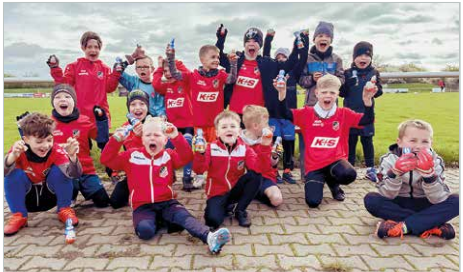
Auf dem Sportplatz am Barleber Anger können fußballbegeisterte Kinder in den Osterferien ihre Technik verbessern und neue Freundschaften schließen.