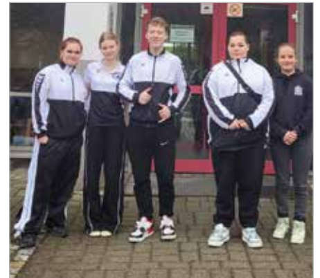
Ehrenamtlicher Einsatz: Fünf Mitglieder der Scheune haben jetzt die JULEICA.

Neben grundlegendem Wissen, das kompetent von den Teamleitern aufbereitet wurde, sollten die Jugendlichen auch kleine Spielideen vorstellen und präsentieren. Schnell schloss man dabei neue Freundschaften mit den Jugendlichen der anderen Sportvereine. Einen zentralen Teil der 45-stündigen Ausbildung bildete die Aufklärung über Gesetze des Jugendschutzes. Nach bestandener Prüfung