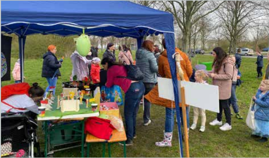
Reichlich Trubel gab es im vergangenen Jahr bei der großen Ostereier-Suche. Das soll auch zu diesem Osterfest so sein.