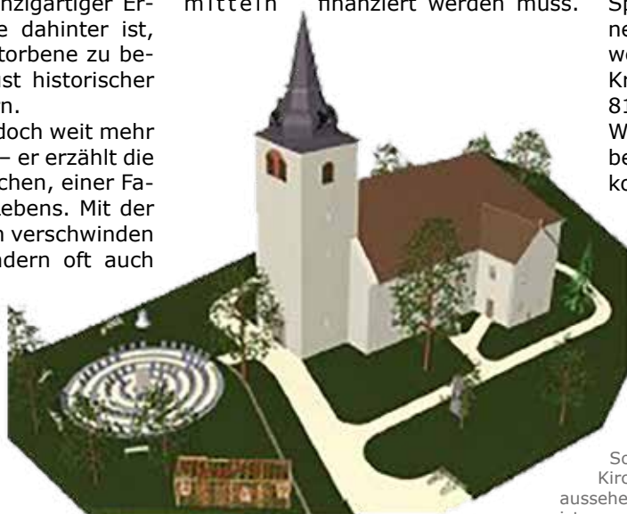
So soll das Gelände rund um die Barleber Kirche „St. Peter und Paul“ an der Kirchstraße aussehen, wenn das geplante Labyrinth einmal fertig ist. Grafik: Förderverein

Helfen Sie mit, einen Ort des Gedenkens und der Erinnerung zu schaffen! (Ute Lüder/aa)