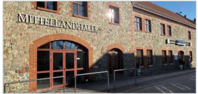
Der Gastrobereich, in dem sich ein griechisches Restaurant befindet, gehört zum Komplex Mittellandhalle.