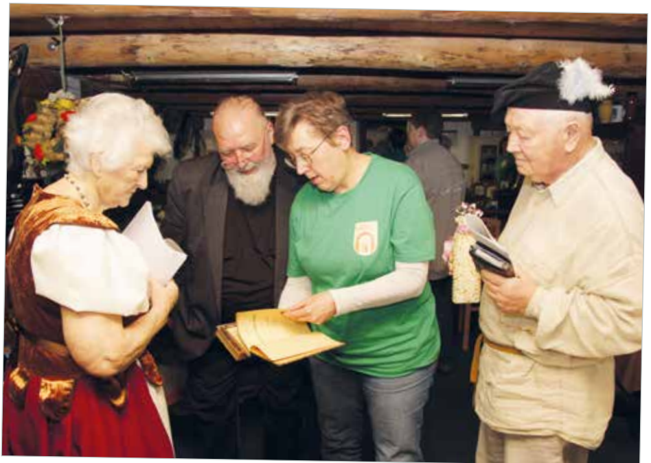
Einige neue Exponate, wie diese Schulbücher aus vergangenen Zeiten, fanden zum Jubiläum gleich noch einen Platz in der Schulausstellung.

Der „Geschichtskreis Meitzendorf e. V.“ ist heute ein aktiver Bestandteil der Gesellschaft. Dank der vielen Unterstützer, Spender und Helfer kann die Tradition bewahrt und die Geschichte Meitzendorfs lebendig gehalten werden. Ein herzliches Dankeschön an alle, die dies möglich gemacht haben! (Geschichtskreis Meitzendorf)