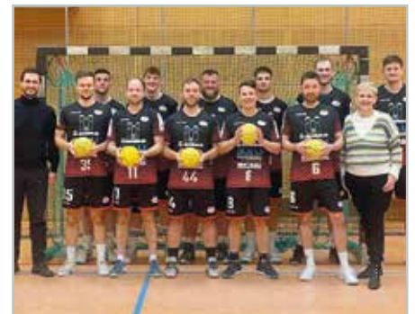
Die neuen Handbälle zaubern den Spielern ein Lachen ins Gesicht und landen hoffentlich oft im gegnerischen Tor.

Den Handball-Spielern war die Freude über die Spende anzusehen. Mit neuen Handbällen ausgestattet sollte nun zahlreichen Toren in der laufenden Saison nichts mehr im Wege stehen. (aa)