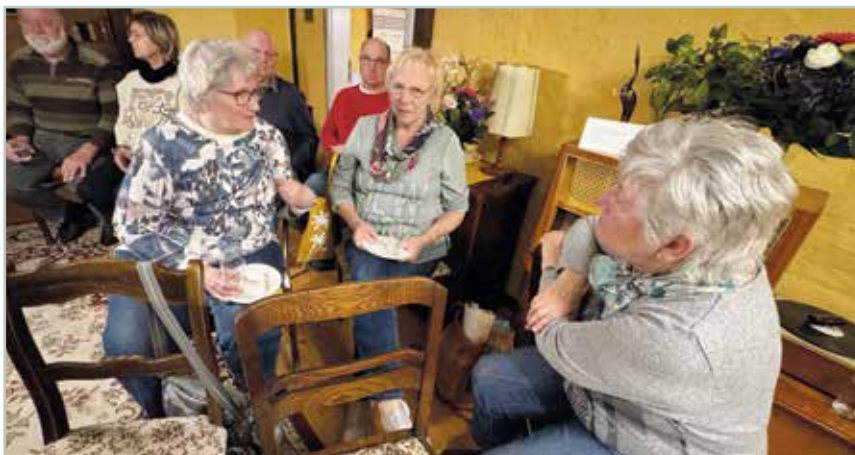
Nach dem offiziellen Teil der Versammlung, tauschten sich die Mitglieder noch lange über die Vereinsarbeit und neue Ideen aus.

Auch im vergangenen Jahr hat der Heimatverein an 12 Festen und Veranstaltungen der Gemeinde teilgenommen und diese mitorganisiert. Darunter waren zum Beispiel: "Gemeinde Barleben putzt sich", Tag der Regionen, der Stand beim IFA-Tag oder der Barleber Weihnachtsmarkt. Während der Versammlung wurden vier Mitglieder für ihr langjähriges Engagement geehrt: