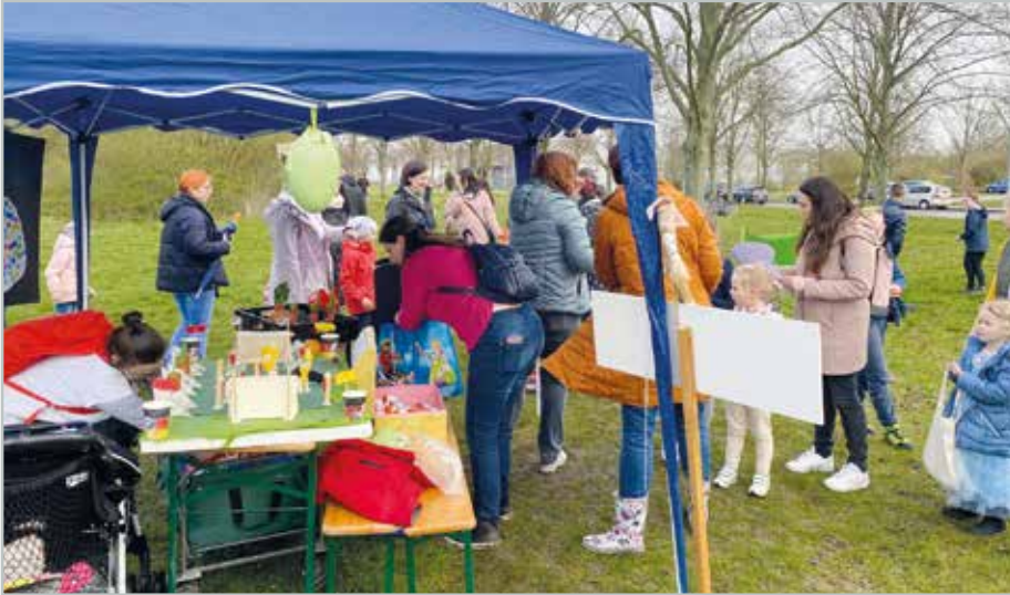
Reichlich Trubel gab es im vergangenen Jahr bei der großen Ostereier-Suche. Das soll auch zu diesem Osterfest so sein.