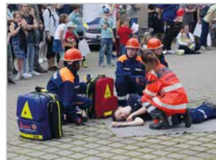
Beim Blaulichttag zeigte unter anderem die Jugendfeuerwehr Barleben ihr Können mit einer Vorführung.

Neben der Rettungshundestaffel, der Landesverkehrswacht mit einem Motorradsimulator sind auch viele weitere Blaulichter vor Ort. Außerdem sind Drohnestaffeln von der Feuerwehr und der Polizei zu erleben. Auch der beliebte Stempellauf für Kinder mit Verlosung wird wieder stattfinden. (tz)