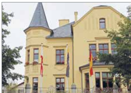
Die Sprechstunde findet im Mai wieder in der Barleber Verwaltung statt.

>> Die für den Montag, 7. April, geplante Bürgermeister-Sprechstunde kann nicht stattfinden. Die nächste Bürgermeister-Sprechstunde findet dann ganz regulär wieder am Montag, 5. Mai, von 16 bis 17 Uhr statt. Bürgerinnen und Bürger sollten bitte im Vorfeld ihr Anliegen schriftlich mitteilen an: buergemeister@barleben.de , damit von Seiten des Bürgermeisters eine Vorbereitung auf das Anliegen möglich ist. (tz)