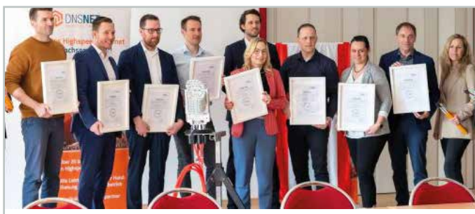
Vertreter der acht Kommunen im Landkreis Börde nehmen die Auszeichnung des Bundesverbandes Breitbandkommunikation entgegen.

Diese acht Kommunen haben in den Jahren 2018/2019 die Projektumsetzung bautechnisch gestartet. Im Jahr 2024 wurde der geförderte Glasfaserausbau insgesamt beendet. Künftig werden über 4.741 Kilometer neu verlegte Glasfaserkabel Datenübertragungen in „Lichtgeschwindigkeit“ ermöglicht. Alle acht kommunalen Netze wurden untereinander verknüpft, wodurch eine sichere Verbindung garantiert ist. (tz)