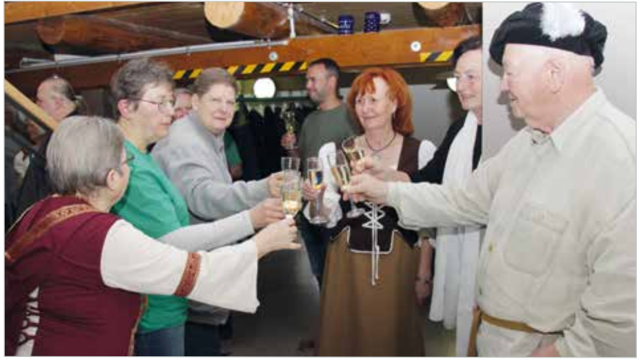
Gemeinsam wurde auf zehn Jahre Geschichtskreis Meitzendorf angestoßen.

2013 war ein Jahr voller Hoffnung: Die Umbauarbeiten des ehemaligen Stalls auf dem „Alten Schulhof“ standen kurz vor dem Abschluss, und der Heimatverein erhielt eigene Räumlichkeiten. Eine Heimatstube, eine Küche und Veranstaltungsräume wurden eingerichtet. Die Mitglieder sortierten und ordneten die Exponate: Im unteren Ausstellungsraum entstanden eine nachgestellte Küche, Wohnstube, Schlafstube, Kinderzimmer sowie eine Sammlung landwirtschaftlicher Geräte. Im Dachgeschoss wurden Ausstellungstafeln zum Leben in Meitzendorf aufgestellt. Besonders engagierten sich bei der Gestaltung der Ausstellungstafeln Margarete und Lothar Berner sowie Wolfgang Gaebel. Leider sind diese