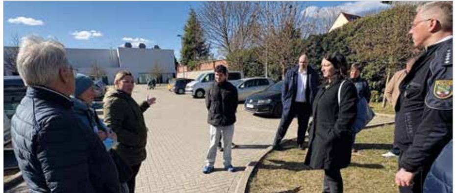
Die Gemeinde Barleben nimmt die Erhöhung der Sicherheit bei öffentlichen Veranstaltungen in den Fokus.