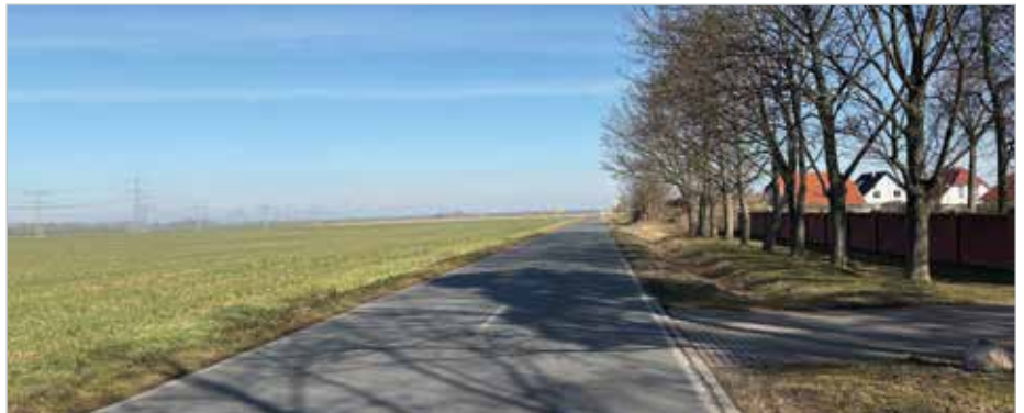
Zwei Bushaltestellen und eine Querungshilfe werden an der Kreisstraße K1167 westlich von Meitzendorf errichtet. Während der Bauarbeiten ist der Bereich voll gesperrt. Der Verkehr wird umgeleitet.

Die neuen Bushaltestellen entstehen an der Kreisstraße K1167, die nach Jersleben führt, am Rand des Wohngebietes „Vogelbreite“. Sie werden als Stahlkonstruktionen mit Flachdächern und Glaselementen errichtet und bieten Fahrgästen Schutz vor Witterungseinflüssen. Zudem werden die Haltestellen je mit einer Sitzbank und einem Abfallbehälter ausgestattet. Die Oberflächen in den Haltestellenbereichen werden mit Betonsteinpflaster analog dem angrenzenden Gehweg verlegt. Die Bushaltestellen sind barrierefrei zu erreichen. Ein wichtiger Bestandteil der Maßnahme ist der Neubau eines Radweges, der das Wohngebiet „Vogelbreite“ in Meitzendorf mit den Bushaltestellen verbindet. Damit wird eine sichere und komfortable Anbindung für Radfahrer geschaffen. Zur Erhöhung der Sicherheit für Fuß-